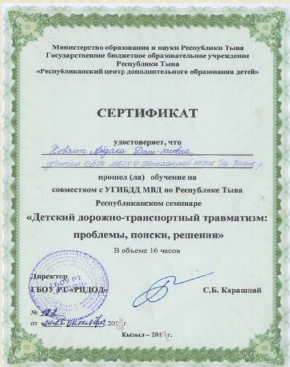
Сертификат участника Республиканского семинара РЦДОД совместно с МВД на тему «Детский дорожно-транспортный транспорт: проблемы, поиски, решения»