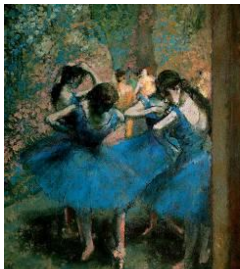
Илер-Жермен- Эдгар Дега