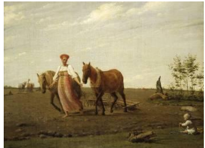
Венецианов Алексей Гаврилович