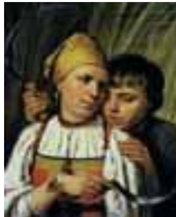
Венецианов Алексей Гаврилович