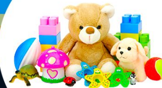
Товары для детей