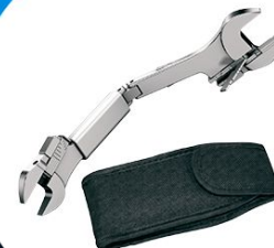
Непонятные товары (нанопластилин, некуб и т.д.)