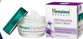
Похудалки, крема, чай, мази без сертификатов