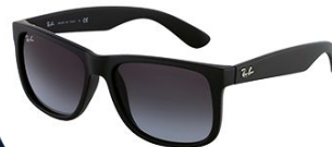
Копии брендов (Ray Ban, Dior, Gucci)