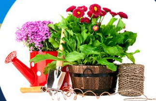
Товары для дома, сада, огорода