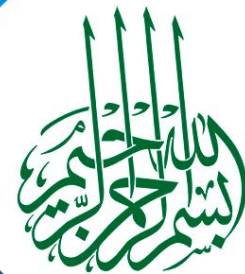
Товары, которые для определеннй наций