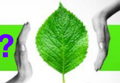
Пути передачи ВИЧ (2014)