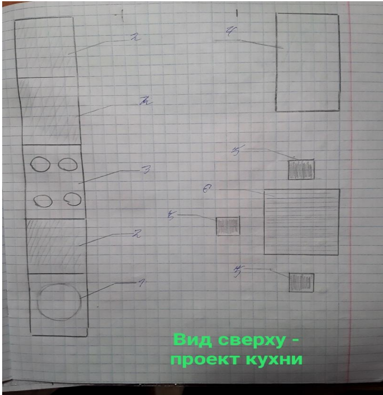
Вид сверху - проект кухни