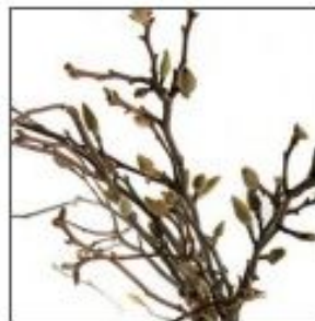
Листья Магнолии пуч