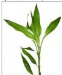
Драцена деремская зеленая