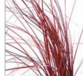
Беарграсс краш красн эл