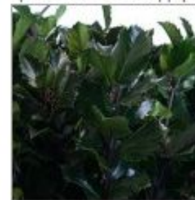
Илекс Блю Принцесс