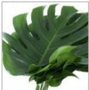
Листья Монстеры Нью