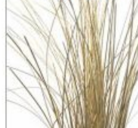
Беарграсс краш зол