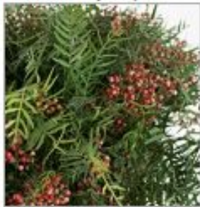
Писташ с ягодами