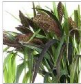
Сетария Италика РэдДжувэл