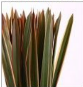
Листья Формиум Тенеке