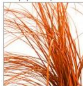
Беарграсс краш оранж