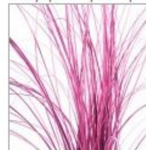
Беарграсс краш роз