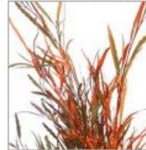
Гривилля краш оранж