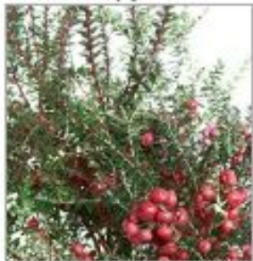
Салал Пернеттия Микроната