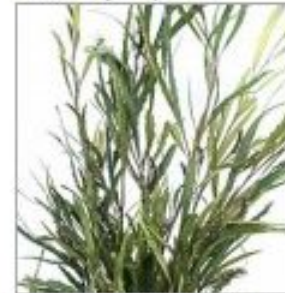
Гривилля краш бел