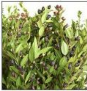
Мирт с ягодами