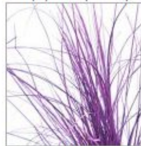
Беарграсс краш фиол