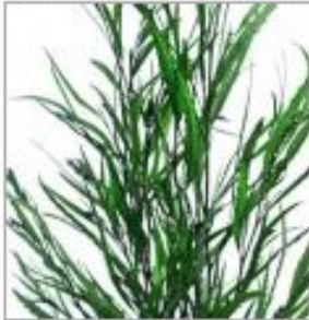
Гривилля краш зел