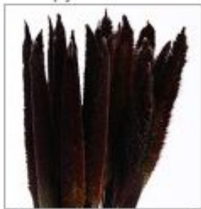
Пеннисетум Перпл МажестикПинус