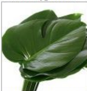
Листья Монстеры мини