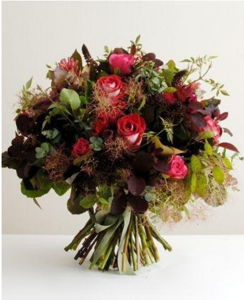
Букет 1/2 шара