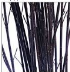
Корнус черн 100 см