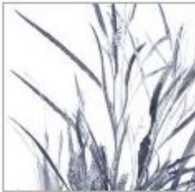
Гривилля краш сереб