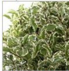
Питтоспорум М.Голд мал су