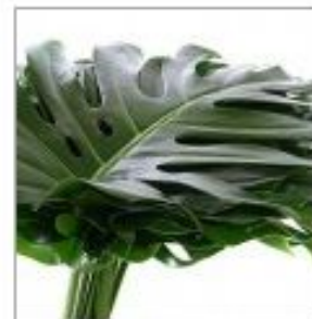
Листья Монстеры бол