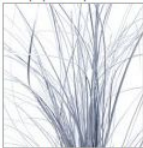
Беарграсс краш сереб