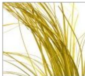
Беарграсс краш жел