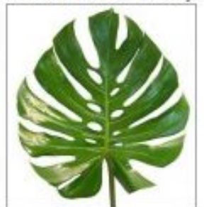
Лист Монстеры ср