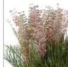
Гривилля Мисти роз