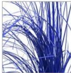
Беарграсс краш син