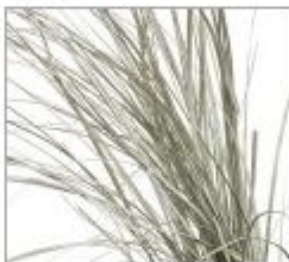
Беарграсс краш бел