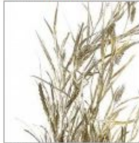
Гривилля краш зол