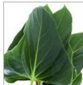
Листья Антуриума мини