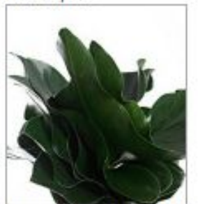
Листья Антуриума Арроу