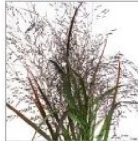
Паникум Фантэйн Скво