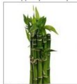
Бамбук прям. с лист