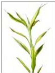
Драцена деремская желтая