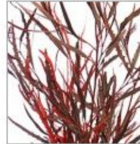
Гривилля краш красн