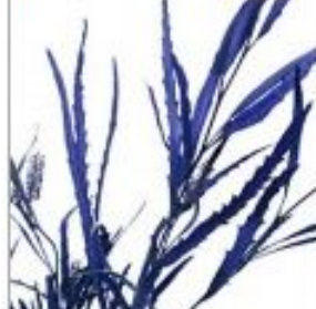
Гривилля краш син