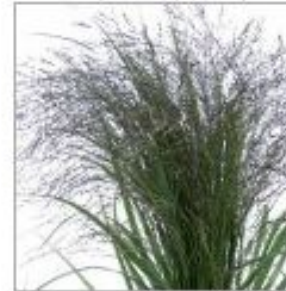
Паникум Фантэйн Уарроу