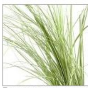
Беарграсс краш милка