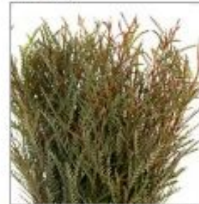
Гривилля Иванхое бронз