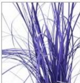
Беарграсс краш лил