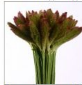
Сетария Италика Томэр