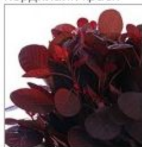
Котинус Роял Перпл