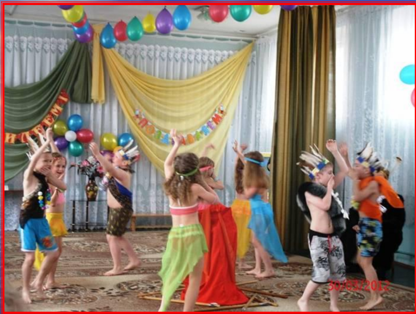
Танец "Пещерные люди"