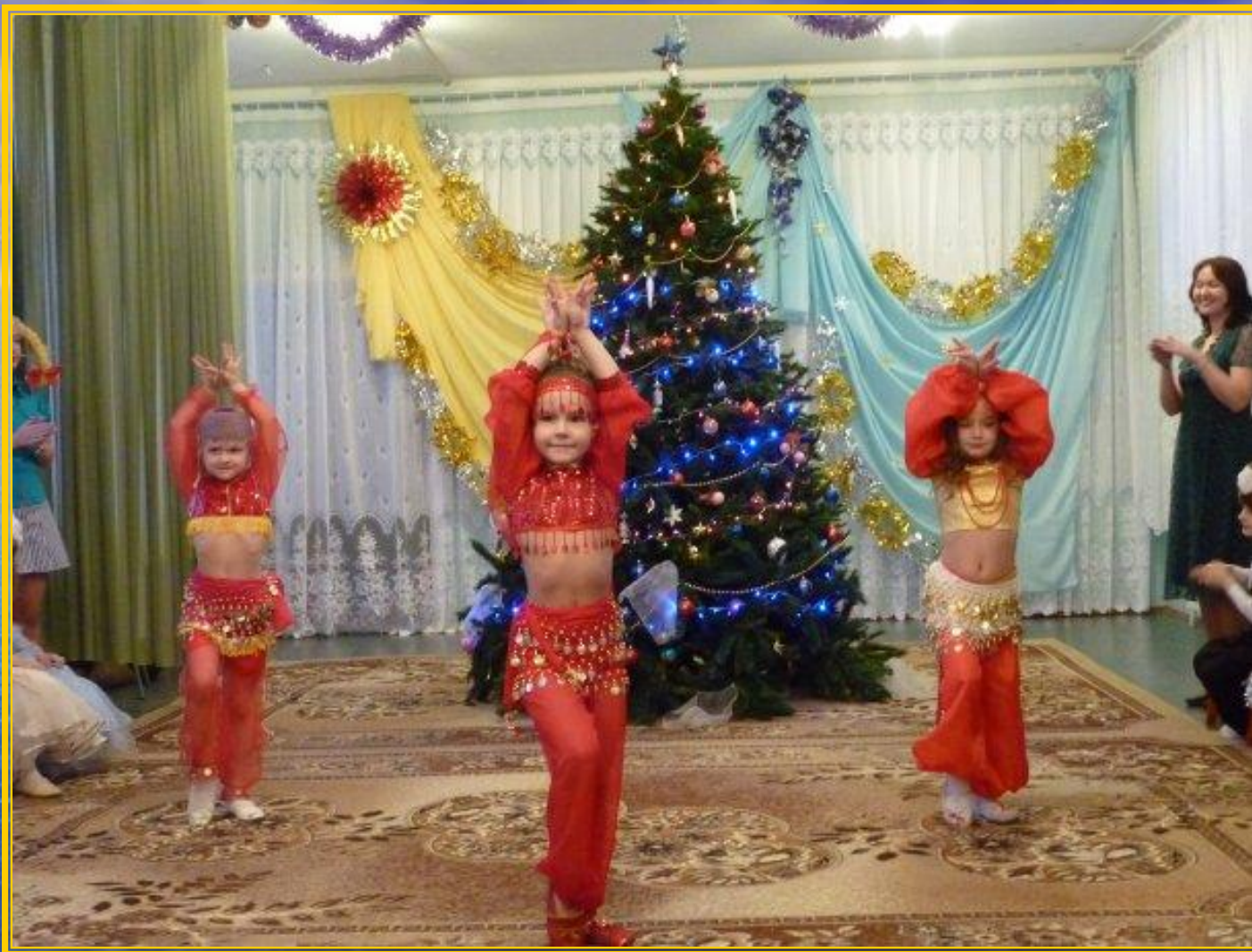
Танец "Восточная сказка"