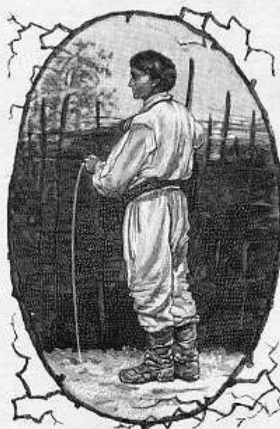
Wiesniak z pod Winnicy.