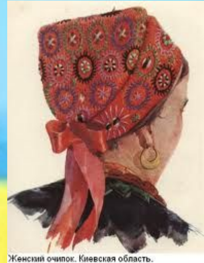
Женский очипок. Киевская область.