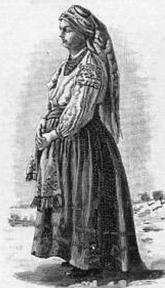
Wiesniaczka z pod Winnicy.