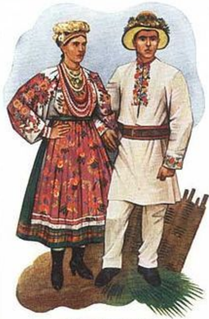
Typy ludowe z Podola