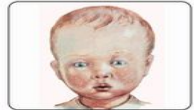
Себорея бровей и головы. Молочные корочки на щеках