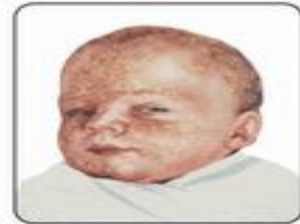
Молочный струп, гнейс