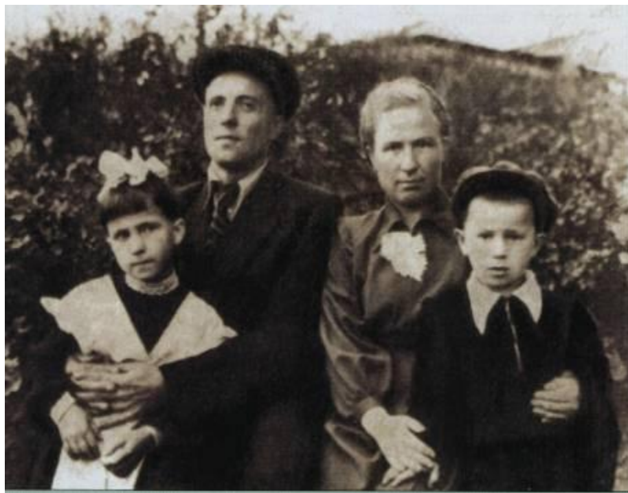
Семья. 1956 год.