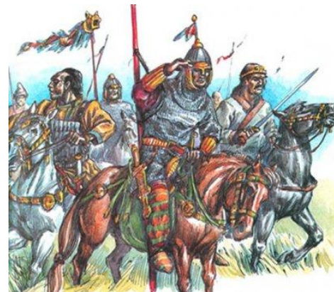
М. Горелик. "Поток гуннов"

Одна из интереснейших культур в истории Бурятии связана с хунну . Гуннская держава просуществовала 300 лет. На северных рубежах своих владений хунну построили форпост – Нижне-Иволгинское городище. На юге Бурятии известно большое число хуннских захоронений, наиболее известное из них найдено в районе Усть-Кяхты, в Ильмовой пади.