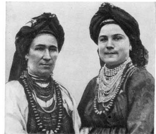
Западные бачуранки (1920-е гг. Читинский музей).

В середине XVIII века за Байкал были переселены из Польши и западных губерний старообрядцы («семейские»).