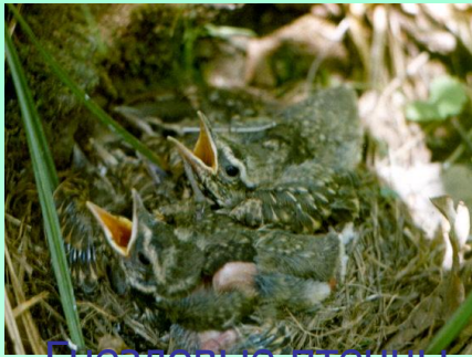
Гнездовые птенцы дрозда