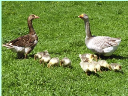
Выводковые птенцы гуся

10. Птицы откладывают яйца с большим запасом питательных веществ и покрытые известковой скорлупой