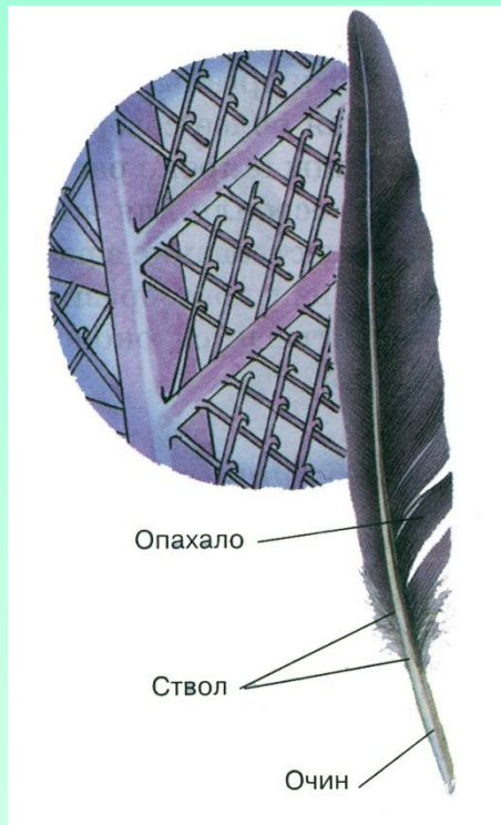
Строение контурного пера

9. Тело покрыто перьями (видоизмененный роговой покров)