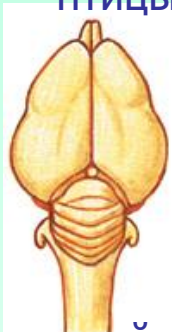
Головной мозг птицы