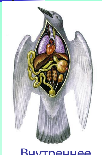
Внутреннее строение птицы