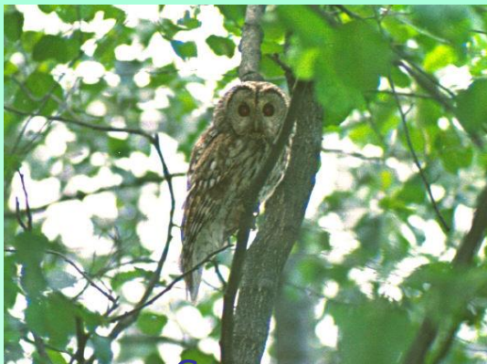
Сова серая неясить