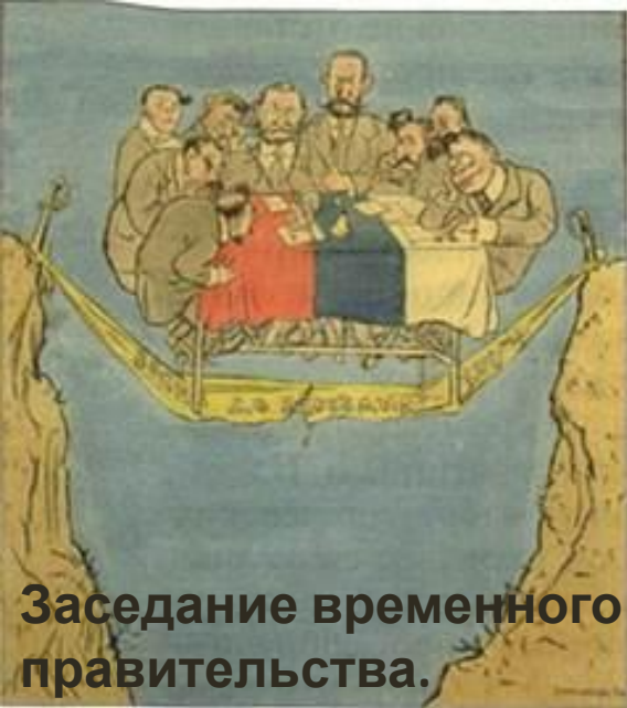
Заседание временного правительства.