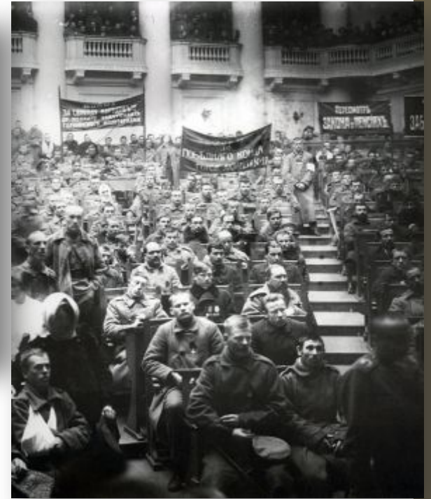
Заседание Совета рабочих и солдатских депутатов в Таврическом дворце