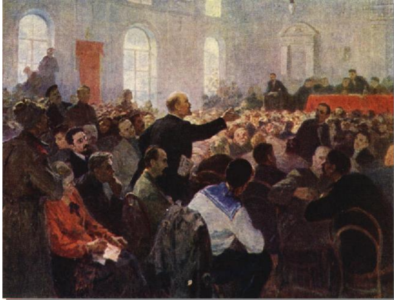
1 Всероссийский съезд Советов. Художник А.А. Кулаков

Избрали ВЦИК – Всероссийский центральный исполнительный комитет в котором преобладали меньшевики и эсеры