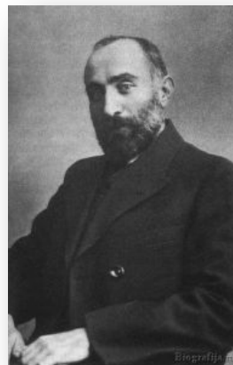
Н.С.Чхеидзе, председатель Исполнительного комитета, меньшевик