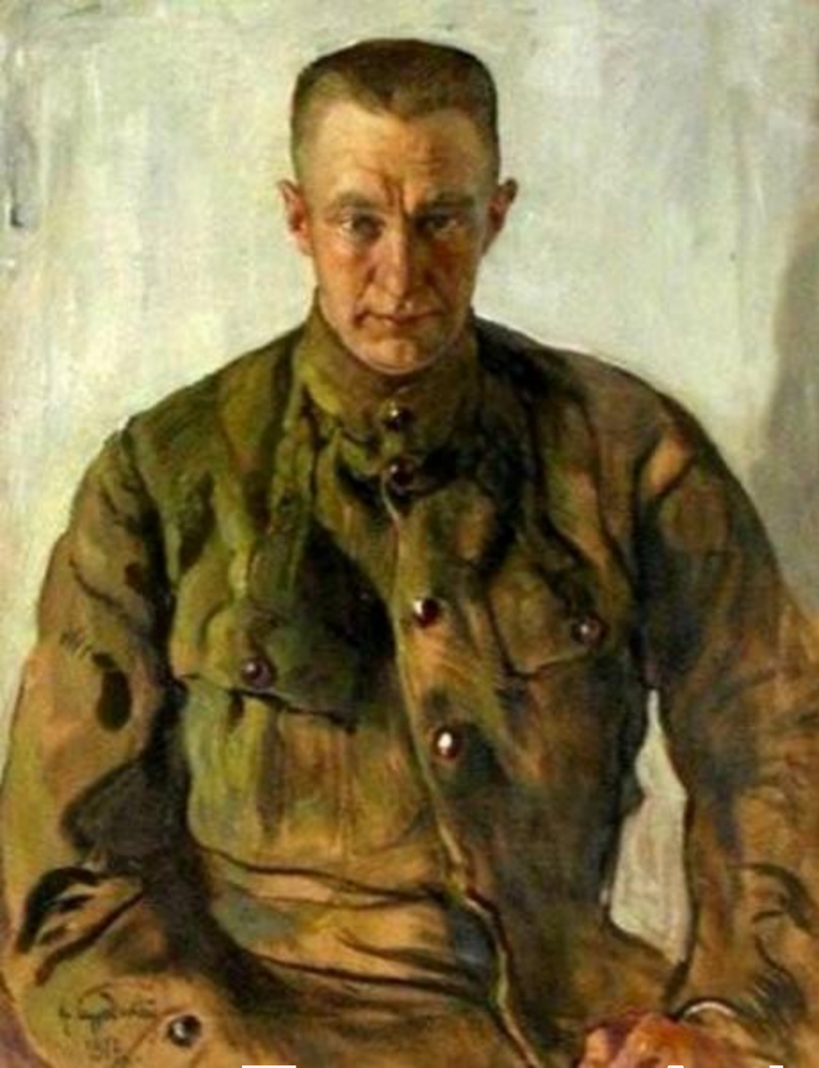
Портрет А.Ф. Керенского