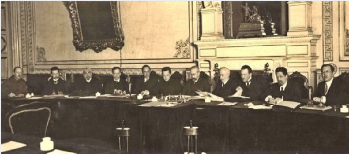
Заседание Временного правительства в Мариинском дворце

В России сложилось двоевластие : страной одновременно управляли Временное правительство и Петроградский Совет и местные советы рабочих, солдатских и крестьянских депутатов