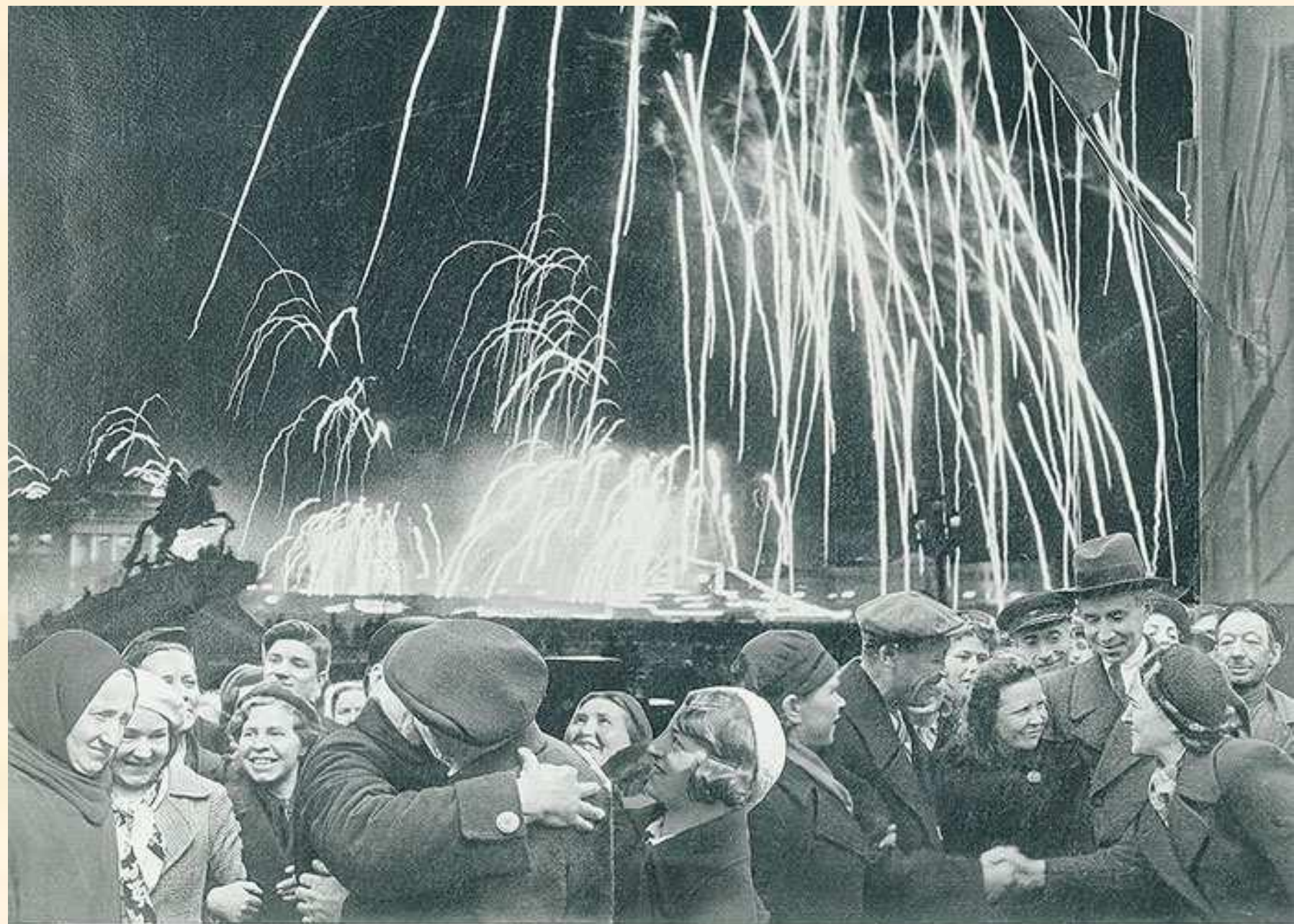
«ВЕЛИКАЯ ПОБЕДА ОДЕРЖАНА СОВЕТСКИМИ ВОЙСКАМИ ПОД ЛЕНИНГРАДОМ: