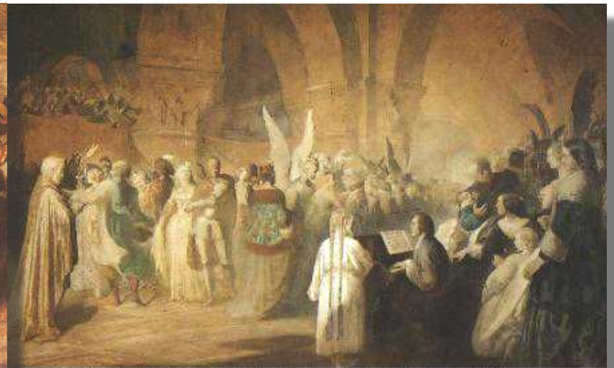
Г. Квятковский. Полонез Шопена - бал в отеле "Ламбер", 1849-1860