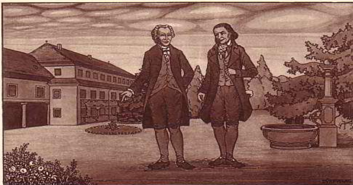
PESTALOZZI UND ISELIN IM BAD SCHINZNACH PESTALOZZI ET ISELIN, AUX BAINS DE SCHINZNACH PESTALOZZI ED ISELIN, AI BAGNI DI SCHINZNACH

СООТВЕТСТВЕННО ЭТОМУ И ПЕРВОНАЧАЛЬНОЕ, ЭЛЕМЕНТАРНОЕ, ОБУЧЕНИЕ И.Г. ПЕСТАЛОЦЦИ ПОДРАЗДЕЛЯЛ НА УМСТВЕННОЕ, ФИЗИЧЕСКОЕ И НРАВСТВЕННОЕ.