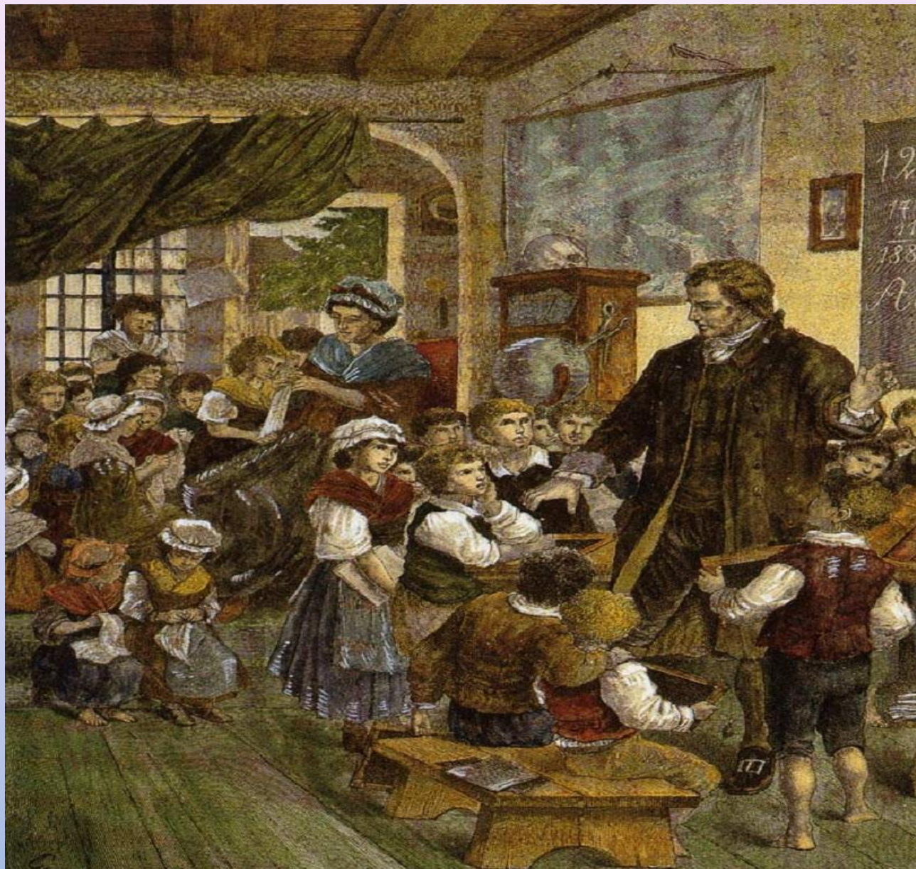
«УЧРЕЖДЕНИЕ ДЛЯ БЕДНЫХ» В НЕЙГОФЕ