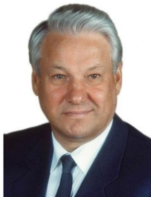
Б.Н.Ельцин. Президент России