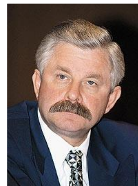
А.В.Руткой Вице-президент России