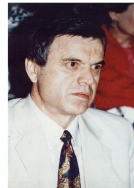
Р.И.Хасбулатов Председатель Верховного Совета РСФСР