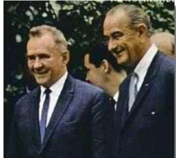
А. Косыгин и Л. Джонсон. Глассборо, 1967г.

1970 г. – установлены системы прямой связи между столицами СССР и США.