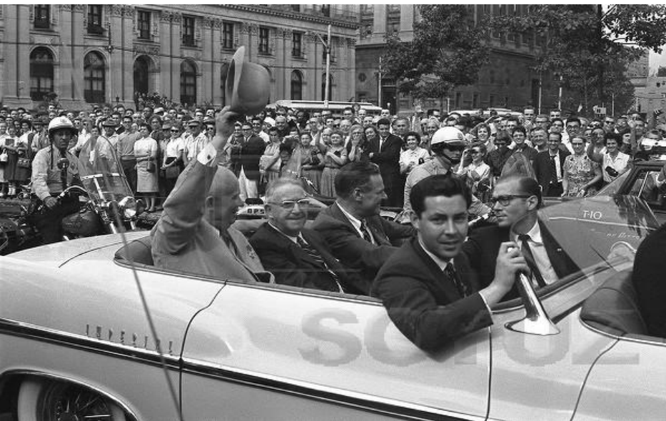
Визит Н.С. Хрущева в США – 1959 г.