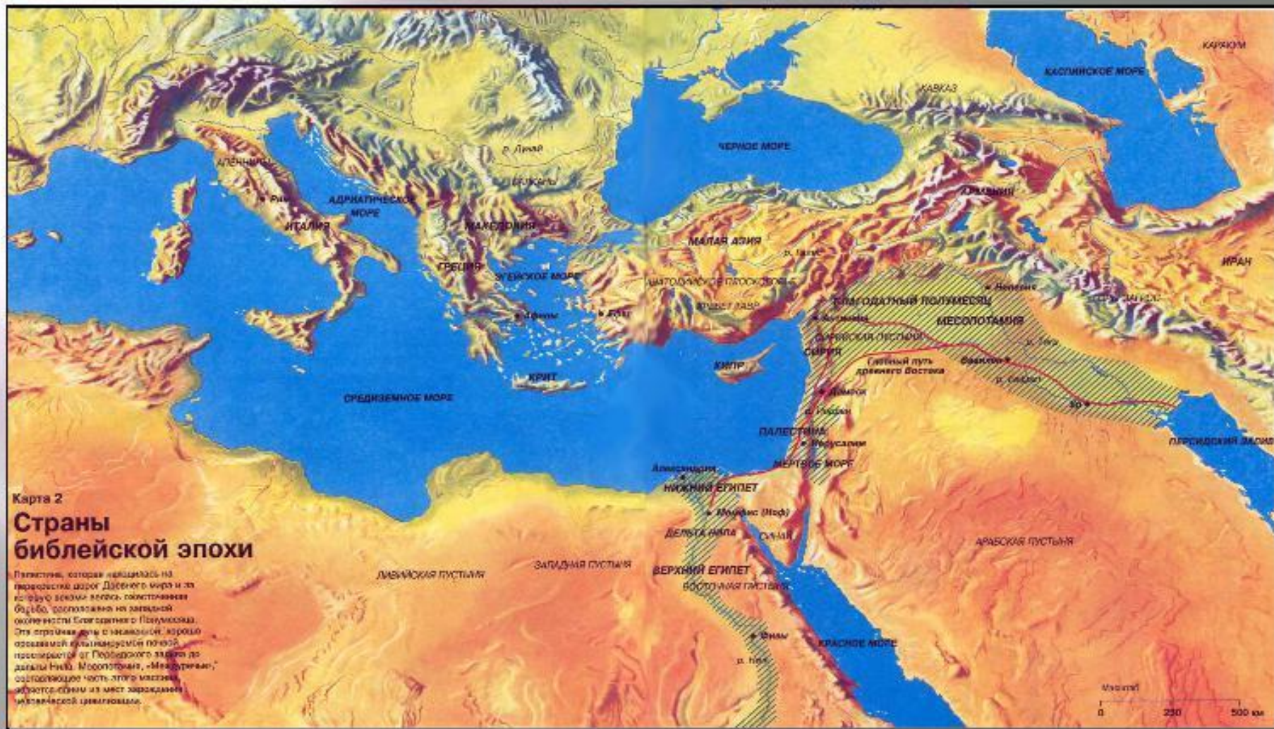
Карта 2 Страны библейской эпохи

Палестина, которая находилась на перекрестке дорог Древнего мира и за которую велись войны, составлявшая бытие, расположена на западной окраине Евразии и Понто-Кавказа. Эта страна была с незапамятных времён осваиваемой культурными народами, перемещавшимися от Персидского залива до дельты Нила. Месопотамия, «Междуречье», составляющее часть этой области, является одним из мест зарождения ивритоязычной цивилизации.