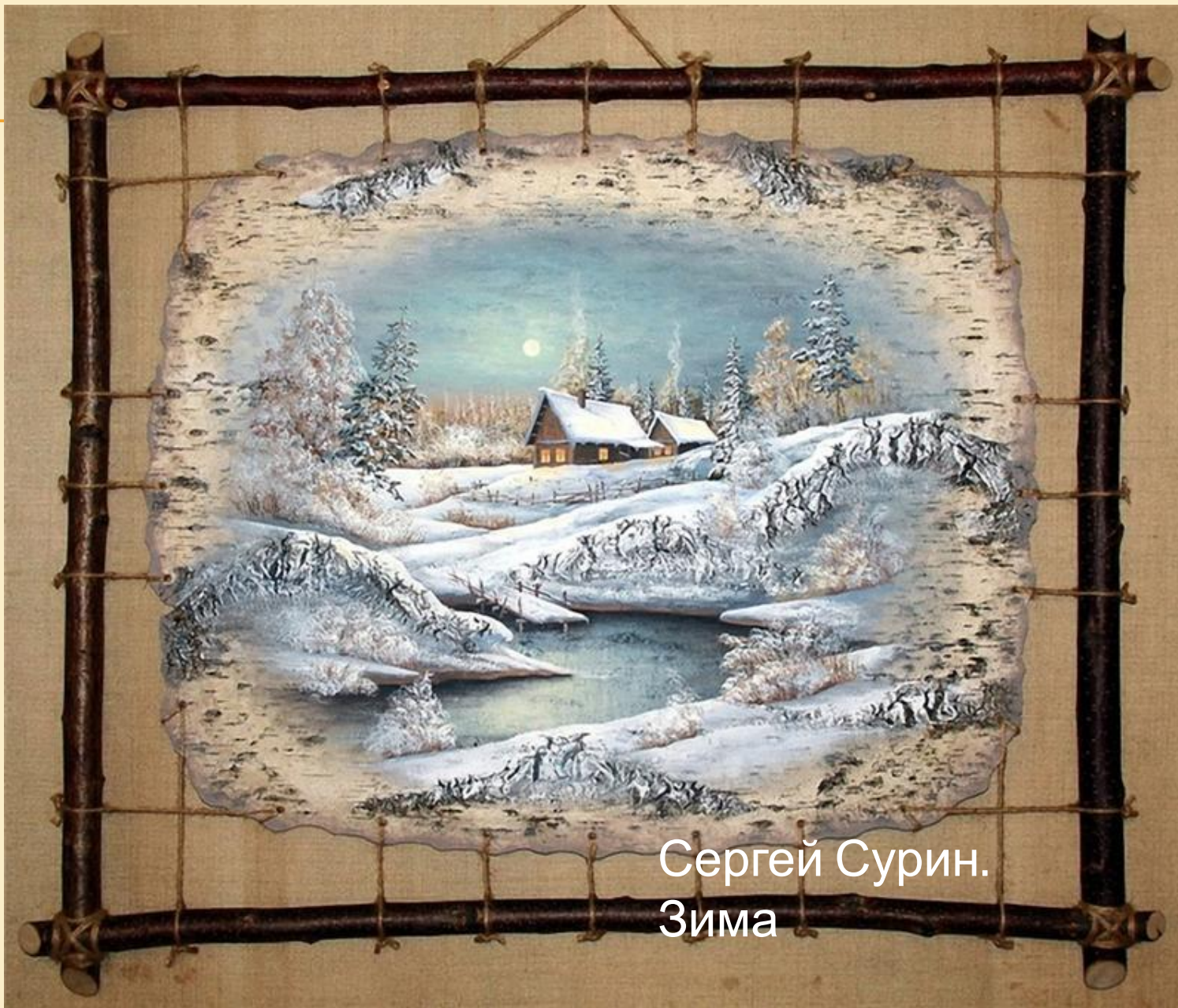
Сергей Сурин. Зима