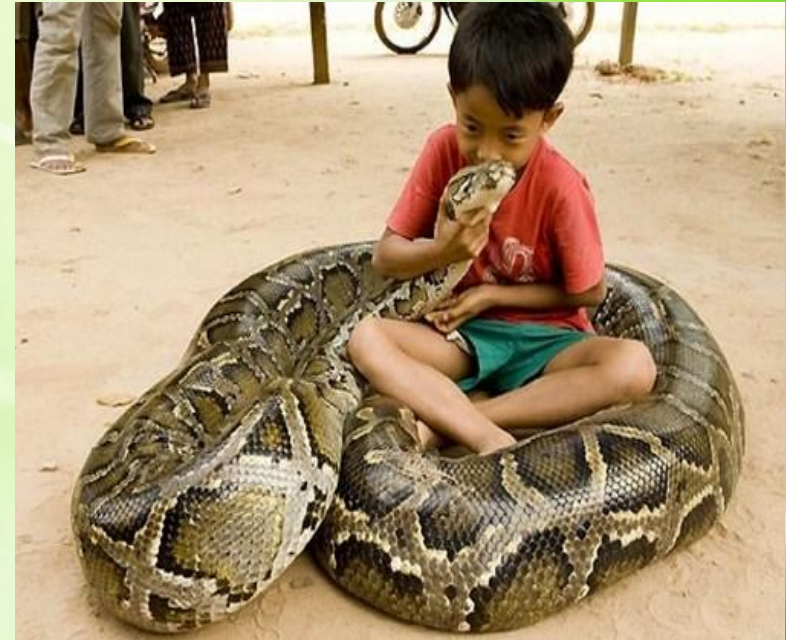
Південноазіатський сітчастий пітон