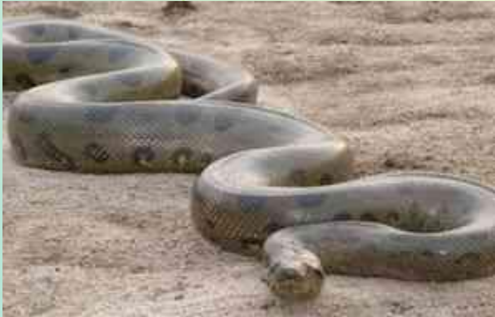
Південноамериканський водяний удав анаконда