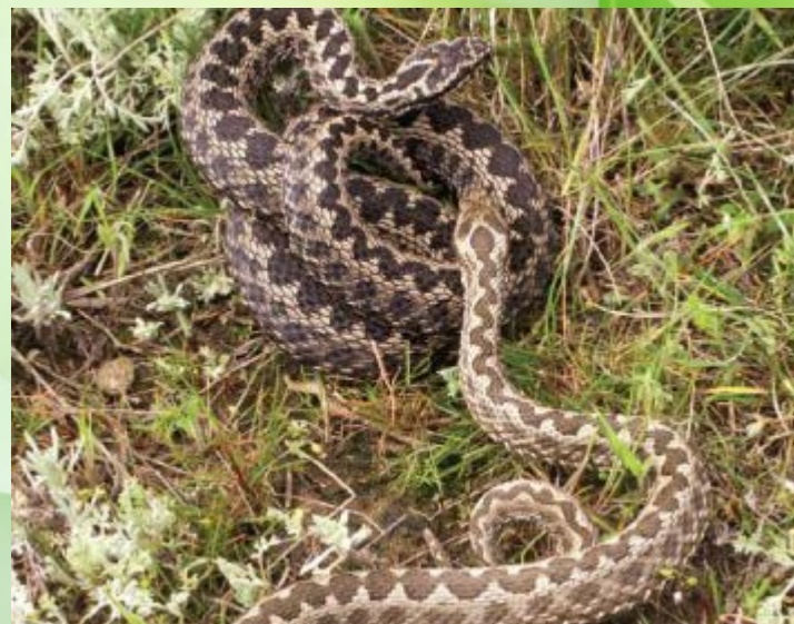
Гадюка степова східна