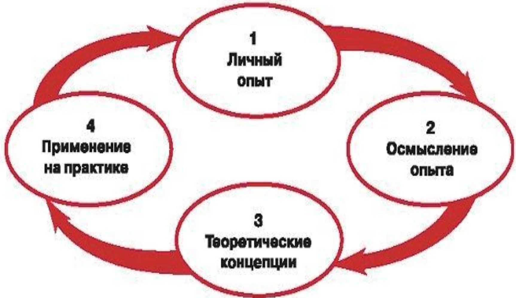
Рис. 2. Цикл обучения Д. Колба