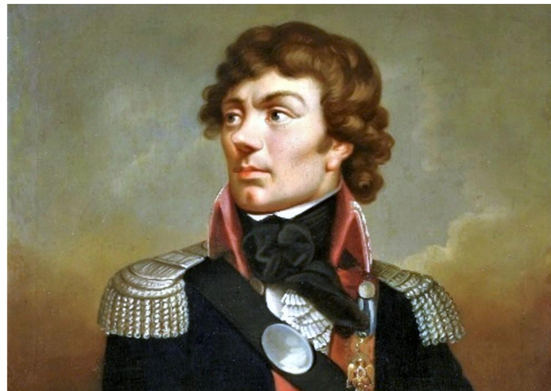
Тадеуш Костюшко (1746-1817)