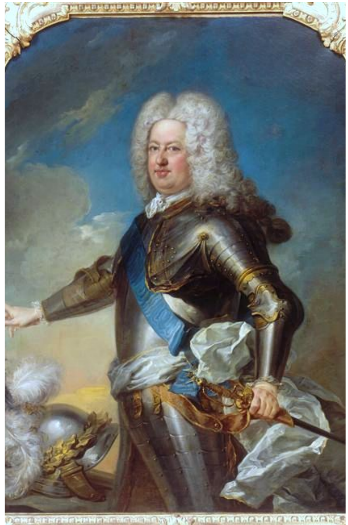
Станислав Лещинский (1677-1766)