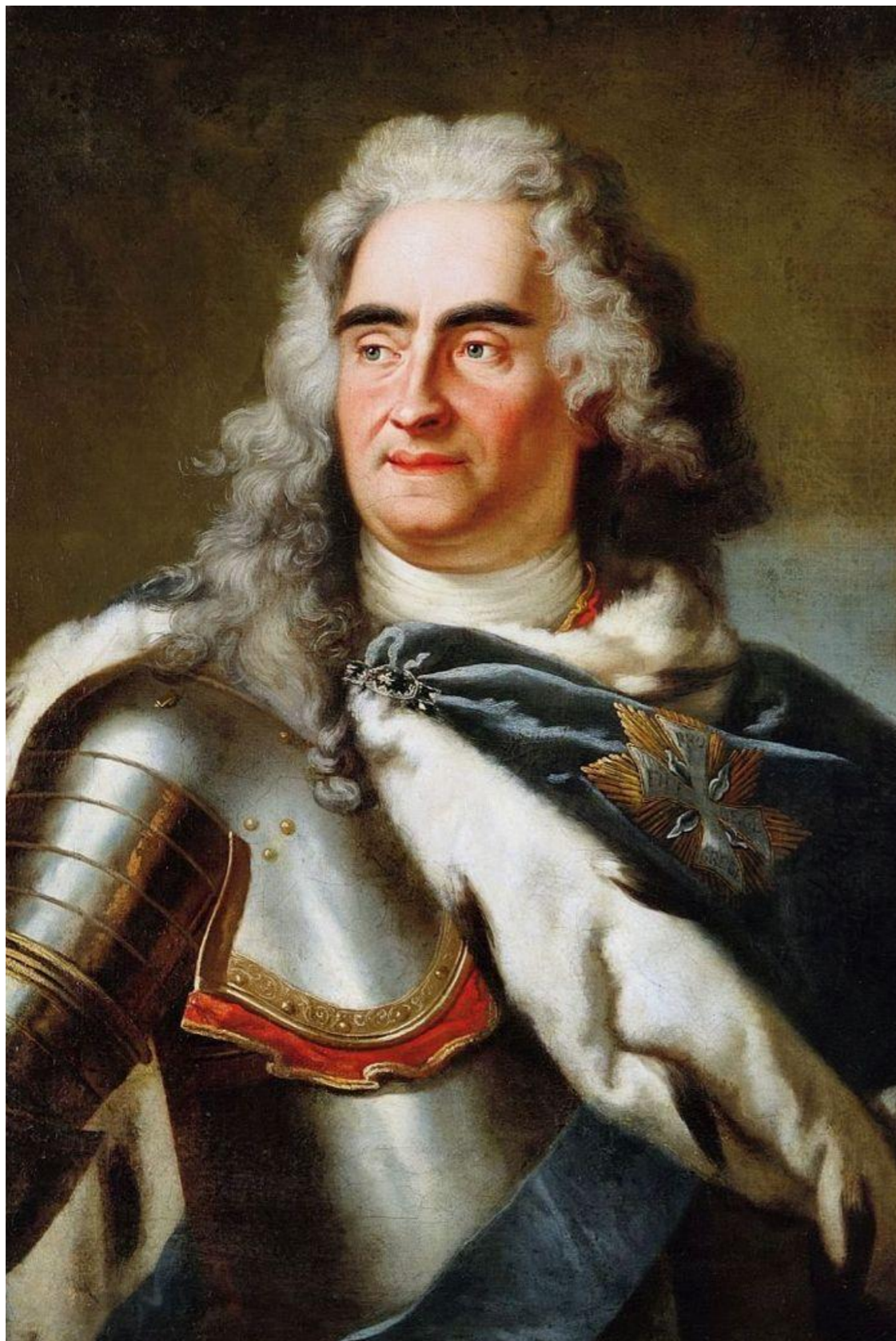
Август II Сильный (1670-1733)