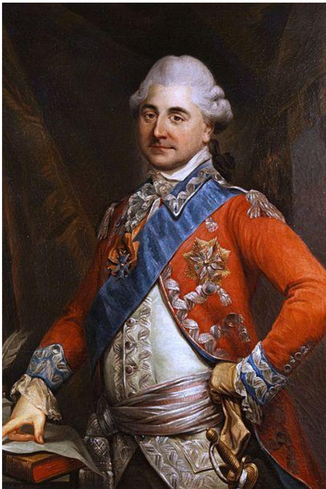
Станислав Понятовский (1732-1798)