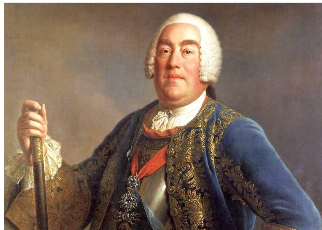
Август III Саксонец (1696-1763)