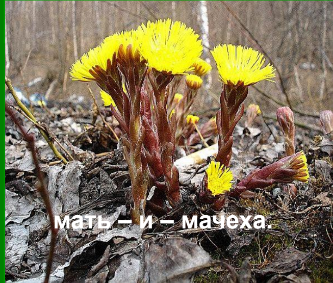
мать – и – мачеха.