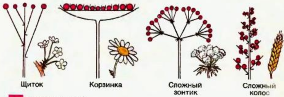
90 Соцветия (схема)