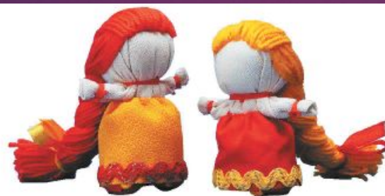
Куклы на счастье