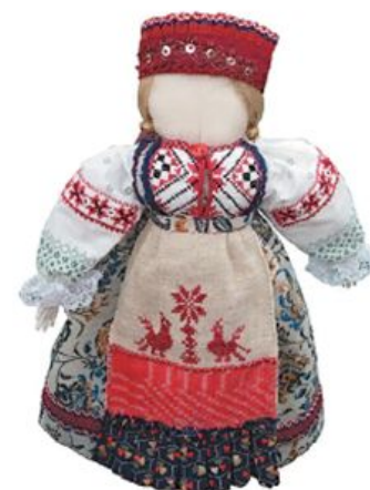
Кукла в русском народном костюме