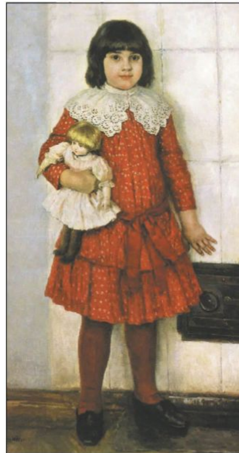
В. И. Суриков. Портрет Ольги Васильевны Суриковой в детстве

Кукла — это часть культуры любого народа. С древних времён, играя с самодельными куклами, дети приучались к труду, учились шить, варить кашу, вышивать, прясть, ткать, осваивали приёмы ухода за детьми. Куклу любили люди всех сословий, бедные и богатые. В российских губерниях куклы отличались формами, материалом, из которого они изготовлялись (это могло быть деревянное полено, лыко, солома, лён, лоскут ткани), имели свои названия, наряды, украшения; у мастеров были свои приёмы изготовления. По всем этим признакам легко узнать, откуда кукла родом.