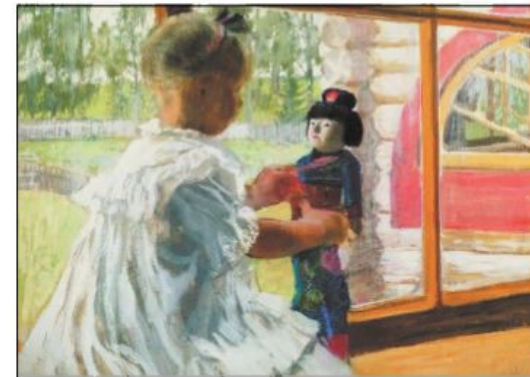
Б. М. Кустодиев. Японская кукла