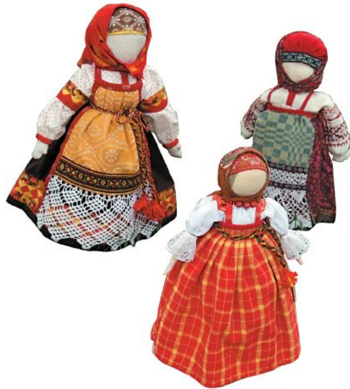
Куклы в русских народных костюмах