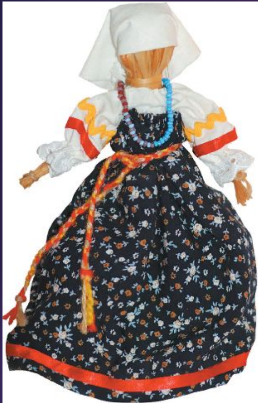
Кукла из мочала