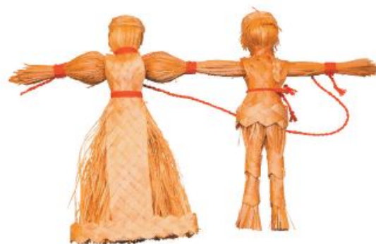
Куклы из соломы