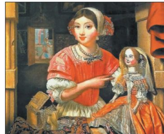
Э. Кольер. Девочка с куклой