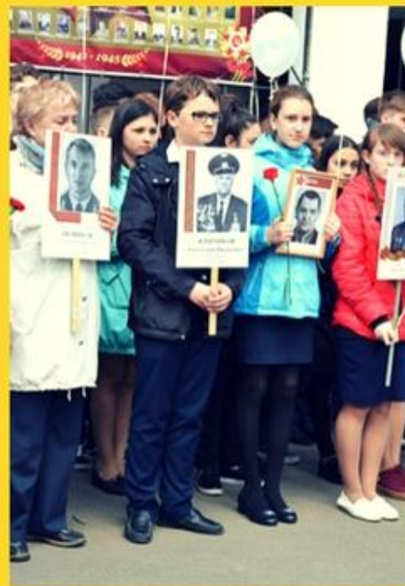
Участие во всероссийской акции "Бессмертный полк"