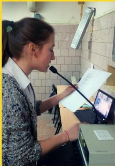
ОРГАНИЗАЦИЯ РАБО- ТЫ ШКОЛЬНОГО РАДИОУЗЛА, УТРЕННЯЯ ЗАРЯДКА