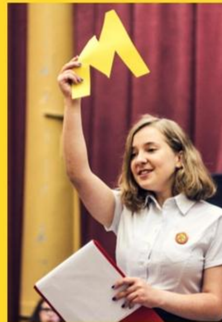
ПОСВЯЩЕНИЕ В ПЕРВОКЛАССНИКИ