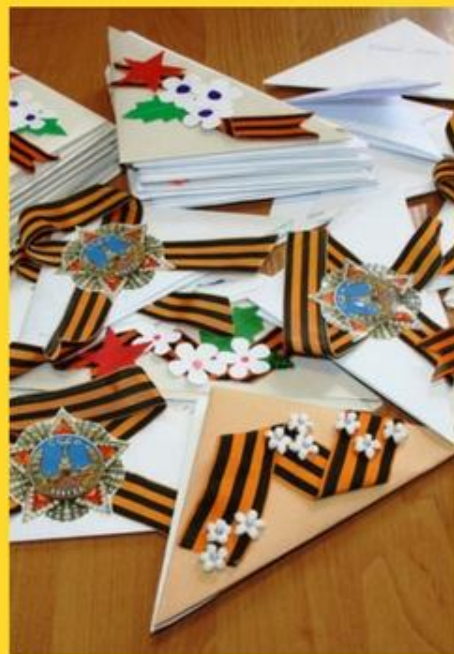
Акция "Письмо ветерану"