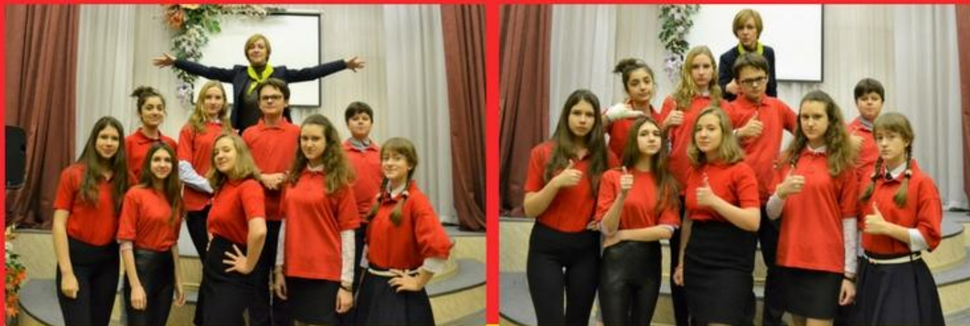
КОМАНДА УЧЕНИЧЕСКОГО САМОУПРАВЛЕНИЯ "С.С.С.Р."