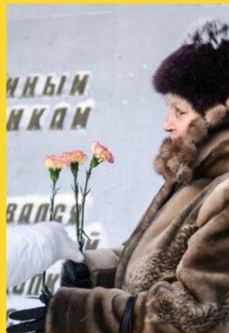
Акция "Подарок ветерану"