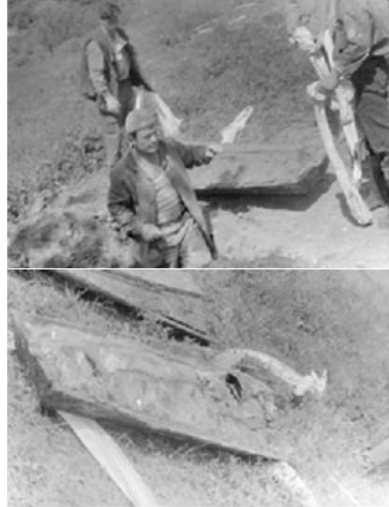
Рис. 321. Этапы эксгумации трупа

А) когда возникает необходимость осмотреть труп;