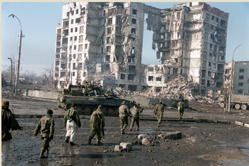
Чечня, Грозный 1994г