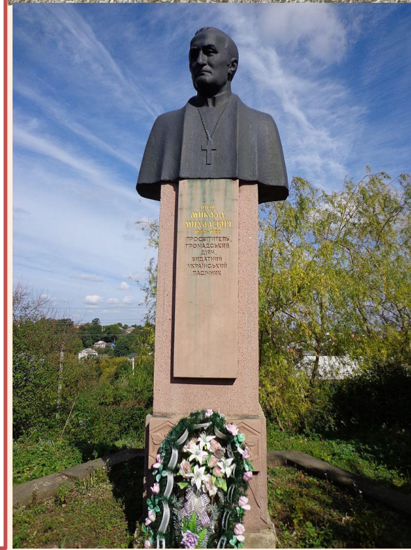
Пам'ятник отцю Миколі Михалевичу