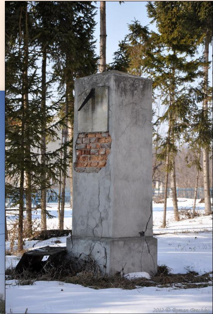
СОНЯЧНИЙ ГОДИННИК (1907, мурований