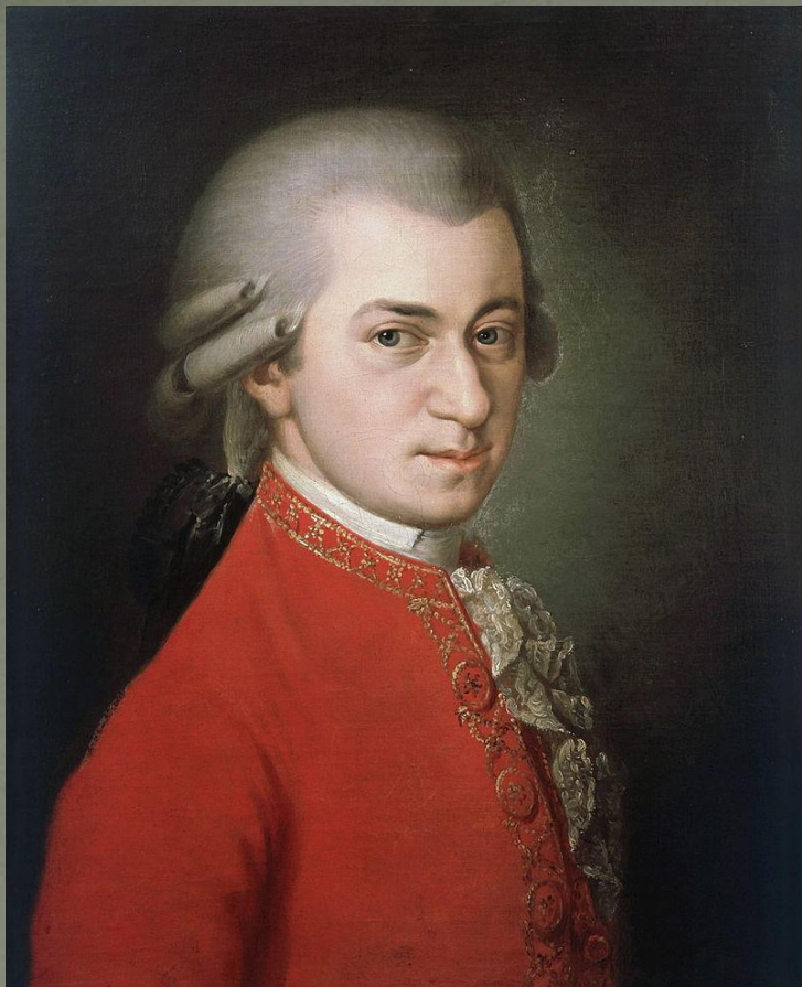
Вольфганг Амадей Моцарт