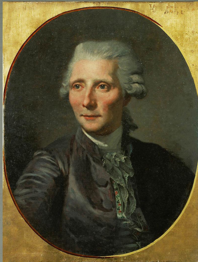
Лоренцо Да Понте

Премьера состоялась 29 октября 1787 года в Сословном театре в Праге. Моцарт и да Понте работали легко, и премьера прошла, по выражению самого Моцарта, «с самым громким успехом».