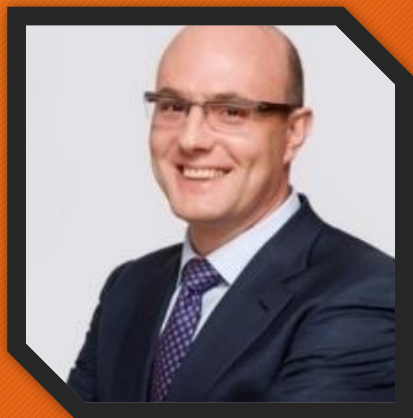
Дмитрий Чернышенко - генеральный директор АО «Газпром-Медиа Холдинг»