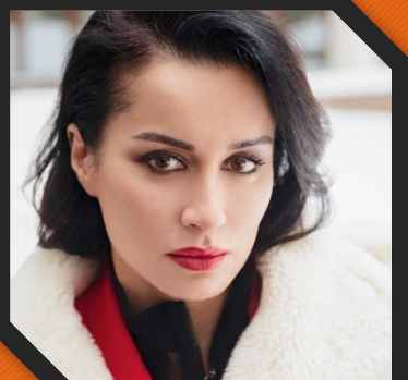
Тина Канделаки - Генеральный продюсер МАТЧ ТВ