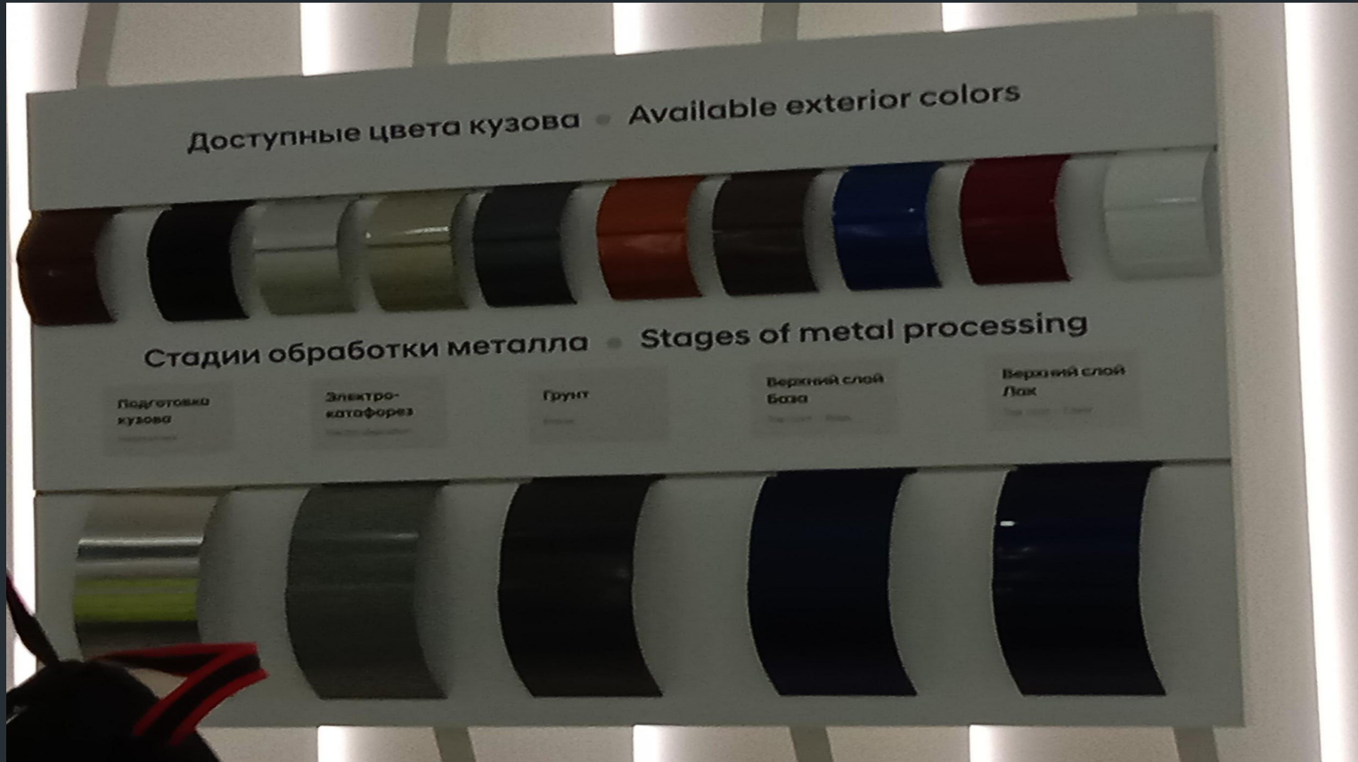
Стадии обработки и окраски