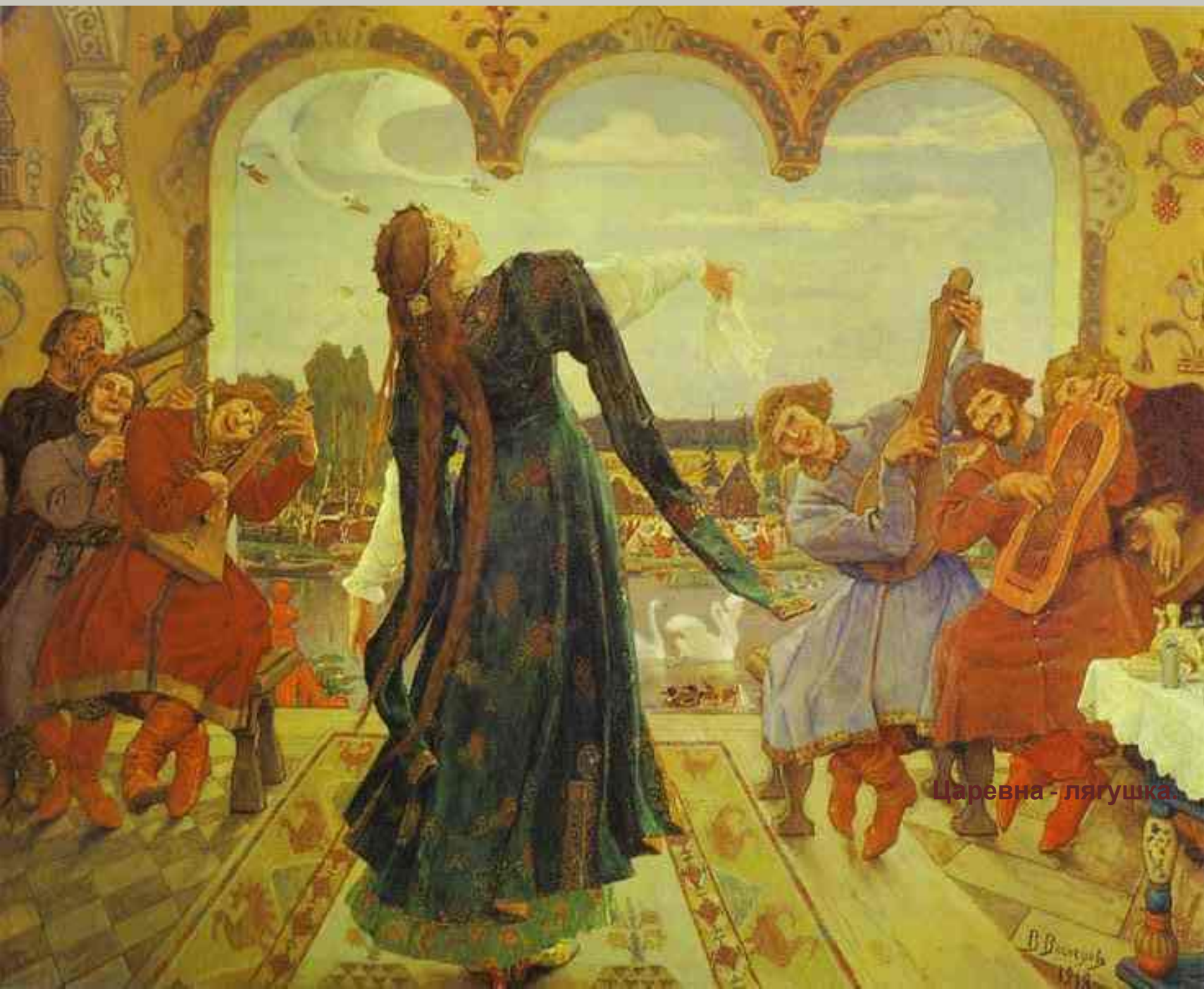
Царевна - лягушка.