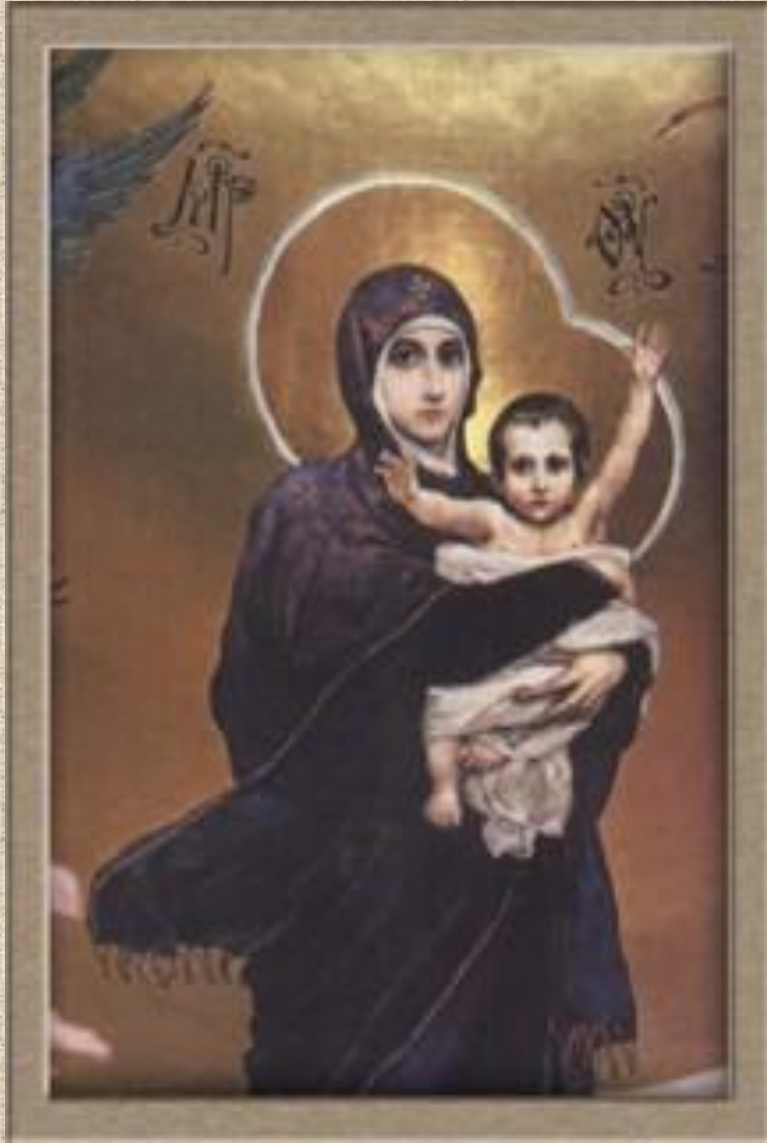
Фрагмент Богоматери во Владимирском соборе

Как родился в художнике образ Богоматери? Детские ли впечатления тому способствовали, рафаэлевская ли Сикстинская мадонна, широко воспроизводимая в иллюстрированных журналах, собственная ли юношеская тяга к выражению идеального («Красота для нас не была сама по себе, а служила отражением и выражением высшей духовной красоты, то есть внутренней, а не внешней только», — объяснял Васнецов В.В. Стасову), но еще в 1871 году, двадцатитрехлетним студентом Академии художеств, он делает эскиз, в котором уже найден в общих чертах будущий образ Богоматери. А через десять лет напишет для иконостаса чудесной абрамцевской церковки Богоматерь в фиолетово-пурпурном мафории, держащую на руках сына со вскинутыми ручками. Но пока это лишь образ прекрасной молодой женщины, воплотившей в себе идеал святого материнства.