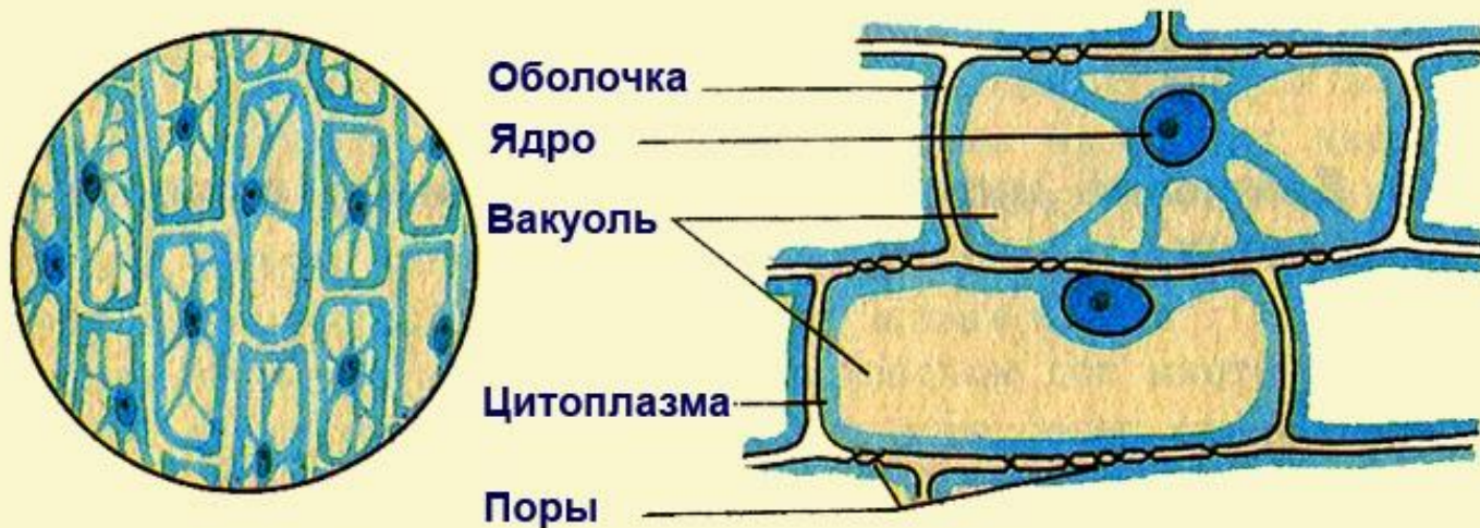
Строение клеток кожицы лука