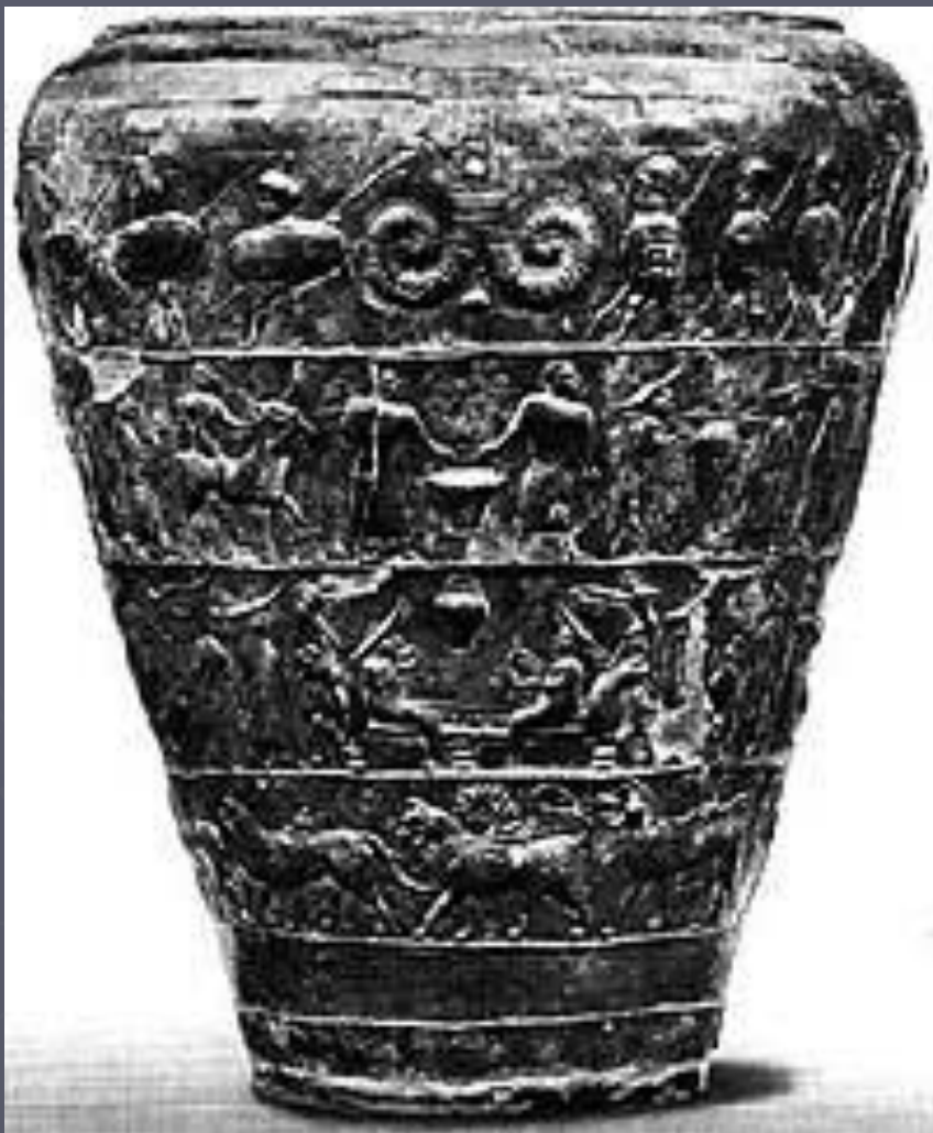
Могильник Чартоза. Ситула. Болонья. Археологический музей

Этруски были отличными граверами. Любили этруски изображать животных, человеческие фигуры и сцены из повседневной жизни. Эти приемы использовались, главным образом для украшения больших бронзовых сосудов-ведер, которые известны под латинским названием "ситула" .