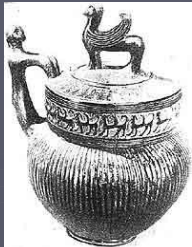
Сосуд стиля "букеро" из погребения