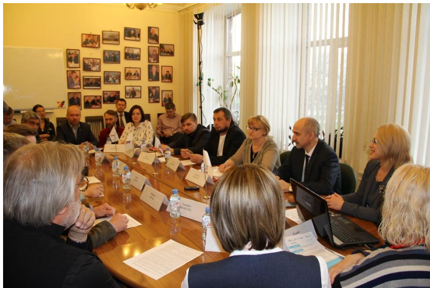
Фото ключевых мероприятий проекта.