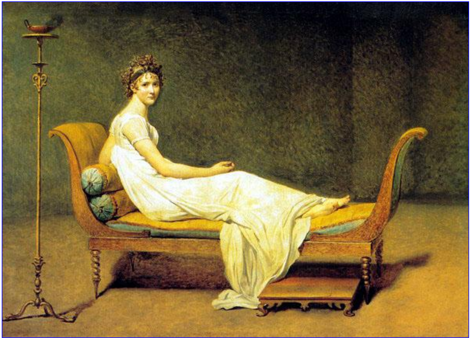
Жак-Луи Давид. Портрет мадам Рекамье, 1800. Париж, Лувр