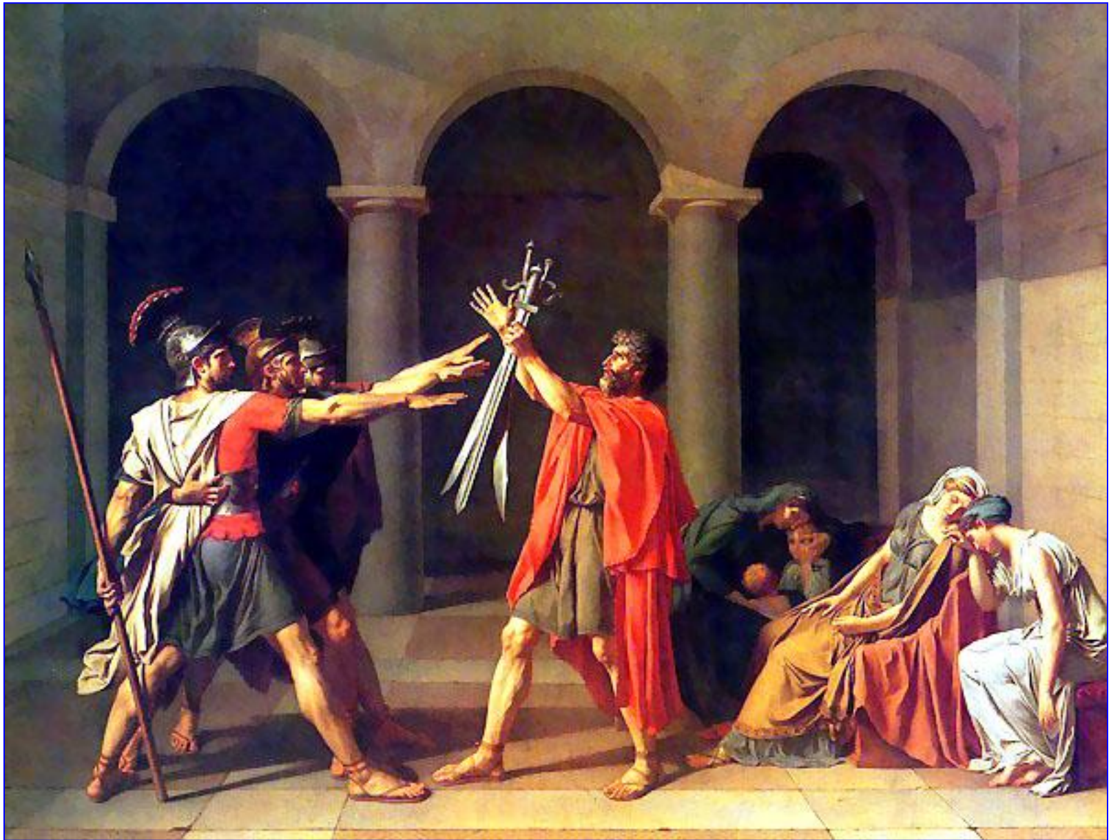
Жак-Луи Давид. Клятва Горацев, 1784. Париж, Лувр