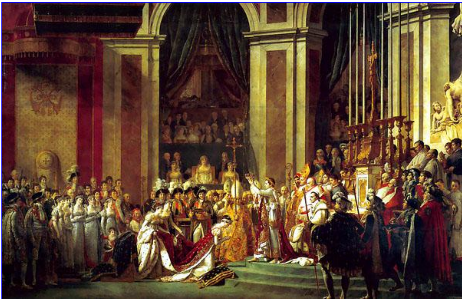
Жак-Луи Давид. Коронация императора Наполеона I и императрицы Жозефины в соборе Парижской Богоматери 2 декабря 1806 года, 1805-1807. Париж, Лувр