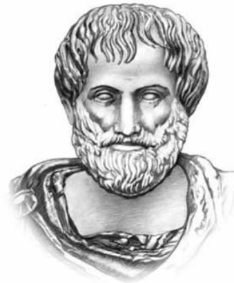
АРИСТОТЕЛЬ 384-322 до н. э.