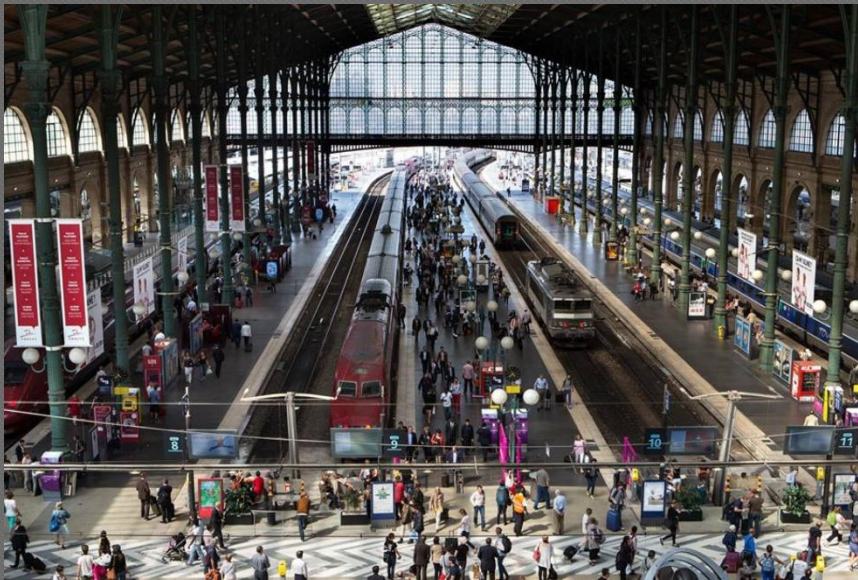
Gare du Nord

Самыми опасными районами французской столицы являются районы, находящиеся вблизи Западного и Северного вокзалов. Здесь проживают мигранты - индийцы, арабы, африканцы, которые не любят чужих, поэтому без надобности туристу этот район лучше не посещать.