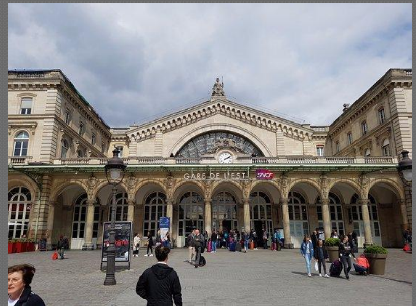
Gare de l'Est