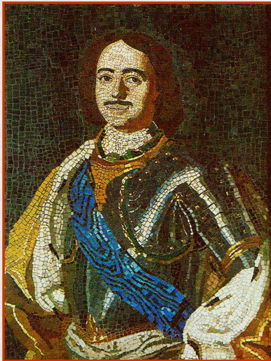
Пётр Первый. М.В. Ломоносов. Мозаика.

Но надо полагать, что отношение Ломоносова к Петру I было искренним.