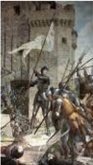
Жанна д'Арк в Орлеане

В ходе моего исследования было изучено много интересного материала, касающегося биографии Жанны, представлены эти различные мнения. Сейчас трудно выяснить ее реальный облик, так как не сохранилось ни одного портрета и статуй, есть только устные описания современников.