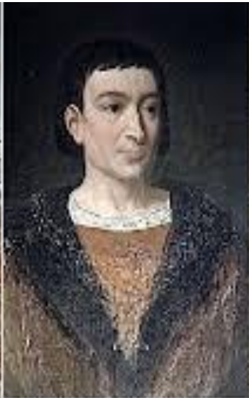
Карл VII (дофин Карл)