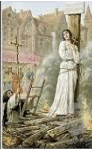
Жанна д'Арк на костре