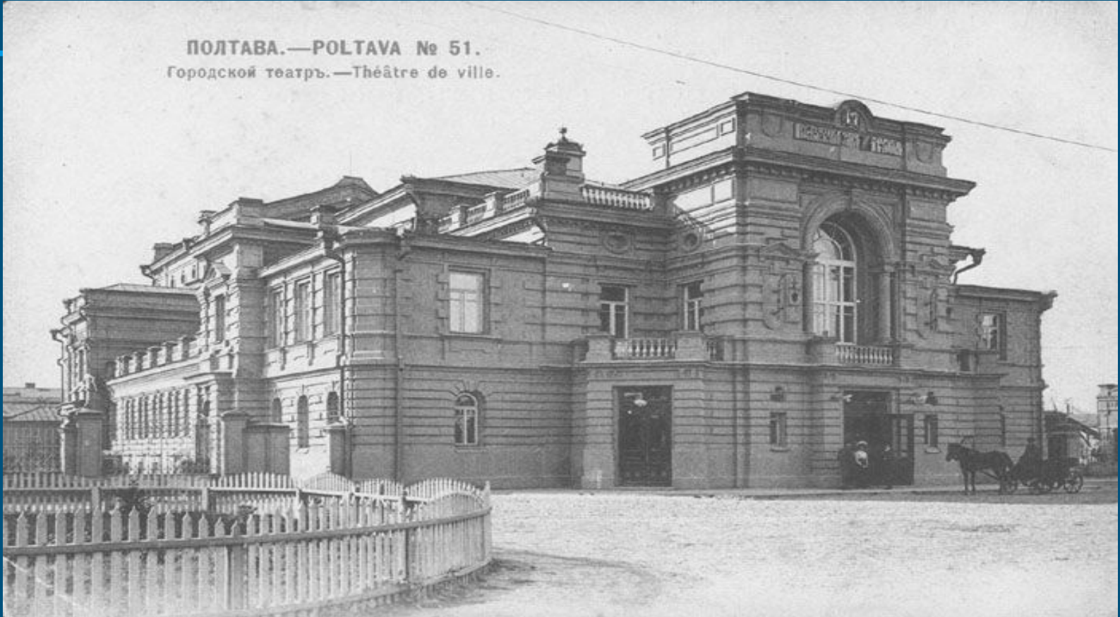
ПОЛТАВА.—POLTAVA № 51. Городской театр.—Théâtre de ville.