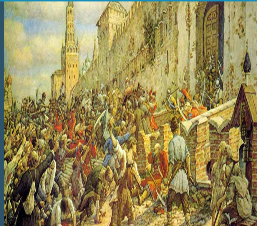
Соляной бунт в Москве, 1648. Худ. Лисснер Э. 1938

После Смутного времени (1598—1613 года) перед новой династией стояла задача восстановления социальной, экономической, политической жизни государства. Происходила постепенная централизация государственной власти, закрепощение крестьян, реформирование налоговой и судебной систем. Население было недовольно изменением законов. Так XVII век, и в особенности время правления царя Алексея Михайловича, часто называют «Бунташным». Именно в это время произошли многие городские и крестьянские восстания: Соляной бунт 1648 года в Москве, «Хлебные бунты» в Новгороде и Пскове, Медный бунт 1662 года, восстание Степана Разина.