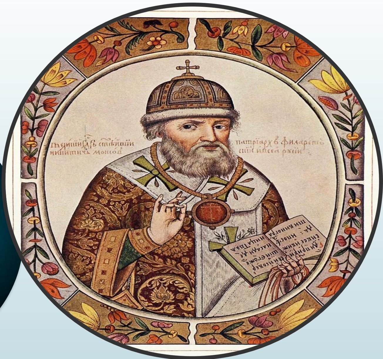
Филарет (Фёдор) Романов