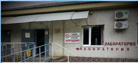
КЛИНИКО-ДИАГНОСТИЧЕСКАЯ ЛАБОРАТОРИЯ АДЫГЕЙСКОГО РЕСПУБЛИКАНСКОГО КЛИНИЧЕСКОГО КОЖНО-ВЕНЕРОЛОГИЧЕСКОГО ДИСПАНСЕРА