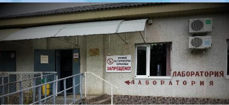
КЛИНИКО-ДИАГНОСТИЧЕСКАЯ ЛАБОРАТОРИЯ АДЫГЕЙСКОГО РЕСПУБЛИКАНСКОГО КЛИНИЧЕСКОГО КОЖНО-ВЕНЕРОЛОГИЧЕСКОГО ДИСПАНСЕРА