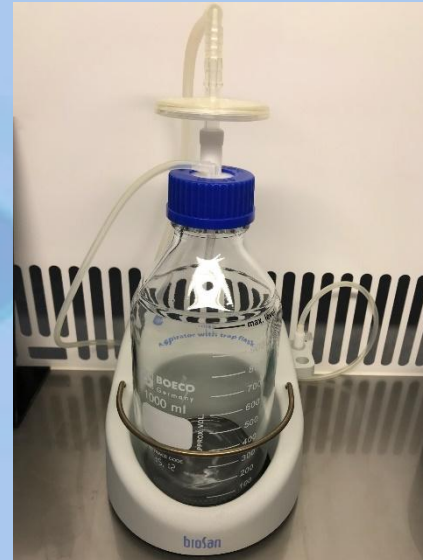
Аспиратор с сосудом-ловушкой