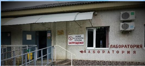
КЛИНИКО-ДИАГНОСТИЧЕСКАЯ ЛАБОРАТОРИЯ АДЫГЕЙСКОГО РЕСПУБЛИКАНСКОГО КЛИНИЧЕСКОГО КОЖНО-ВЕНЕРОЛОГИЧЕСКОГО ДИСПАНСЕРА