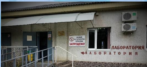
КЛИНИКО-ДИАГНОСТИЧЕСКАЯ ЛАБОРАТОРИЯ АДЫГЕЙСКОГО РЕСПУБЛИКАНСКОГО КЛИНИЧЕСКОГО КОЖНО-ВЕНЕРОЛОГИЧЕСКОГО ДИСПАНСЕРА