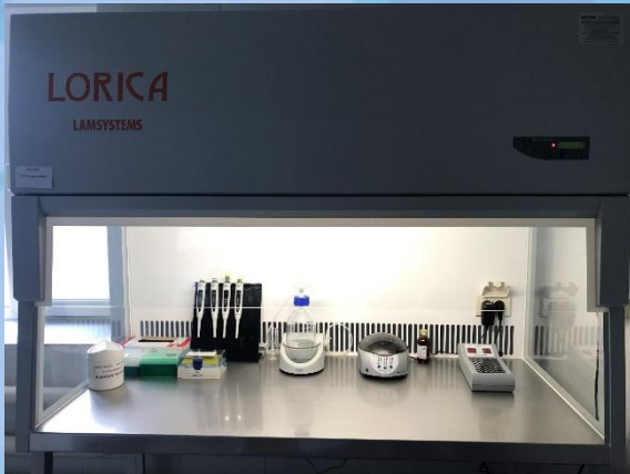
Бокс абактериальной воздушной среды БАПВ-01 Ламинар-с

КЛИНИКО-ДИАГНОСТИЧЕСКАЯ ЛАБОРАТОРИЯ АДЫГЕЙСКОГО РЕСПУБЛИКАНСКОГО КЛИНИЧЕСКОГО КОЖНО-ВЕНЕРОЛОГИЧЕСКОГО ДИСПАНСЕРА