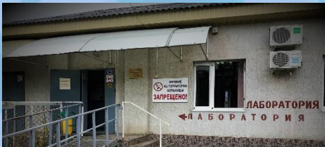
КЛИНИКО-ДИАГНОСТИЧЕСКАЯ ЛАБОРАТОРИЯ АДЫГЕЙСКОГО РЕСПУБЛИКАНСКОГО КЛИНИЧЕСКОГО КОЖНО-ВЕНЕРОЛОГИЧЕСКОГО ДИСПАНСЕРА