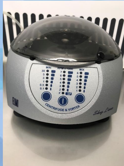
Мини центрифуга «Вортекс»