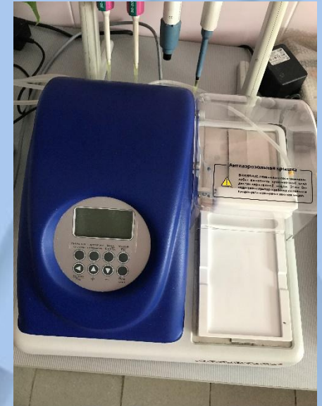
Промыватель планшетов «Акварин»