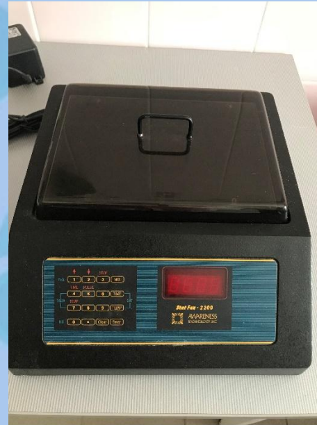
Термостатирующий шейкер StatFax 2200