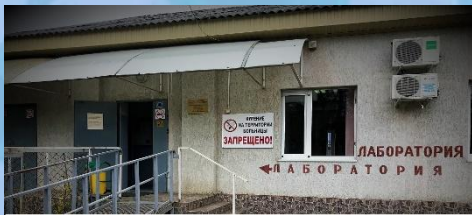
КЛИНИКО-ДИАГНОСТИЧЕСКАЯ ЛАБОРАТОРИЯ АДЫГЕЙСКОГО РЕСПУБЛИКАНСКОГО КЛИНИЧЕСКОГО КОЖНО-ВЕНЕРОЛОГИЧЕСКОГО ДИСПАНСЕРА