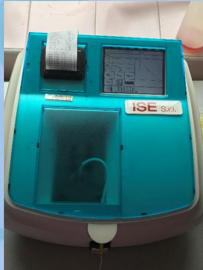
Анализатор полуавтоматический биохимический с принадлежностями «Minitelno»