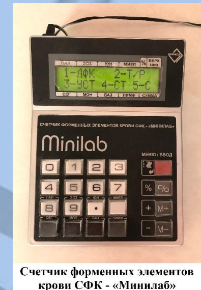
Счетчик форменных элементов крови СФК - «Минилаб»