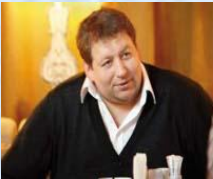
Станисла́в Ду́жников — российский актёр театр а, кино, телевидения и дубляжа. Заслуженный артист России. Заслуженный артист Республики Мордовия.