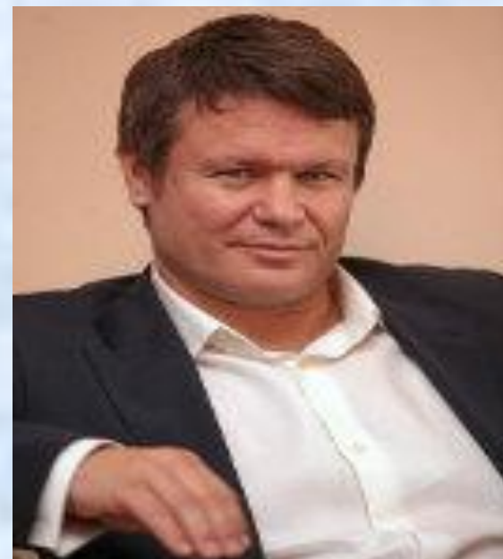
Такта́ров Олег — российский и америка нский спортсмен, актёр, телеведущий, ки нопродюсер, режиссёр, общественный деятель. Чемпион мира по смешанным боевым искусствам и призёр многих спортивных турниров и соревнований. Выступал под псевдонимом «Русский медведь»