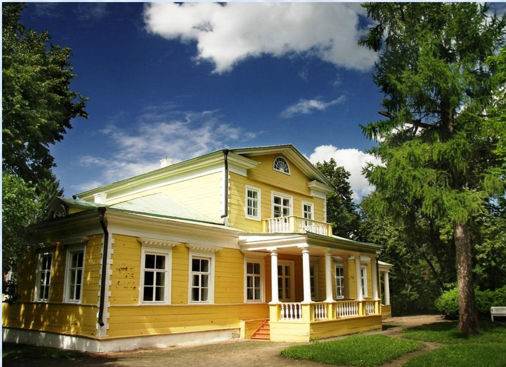
Болдино – родовое имение А.С.Пушкина