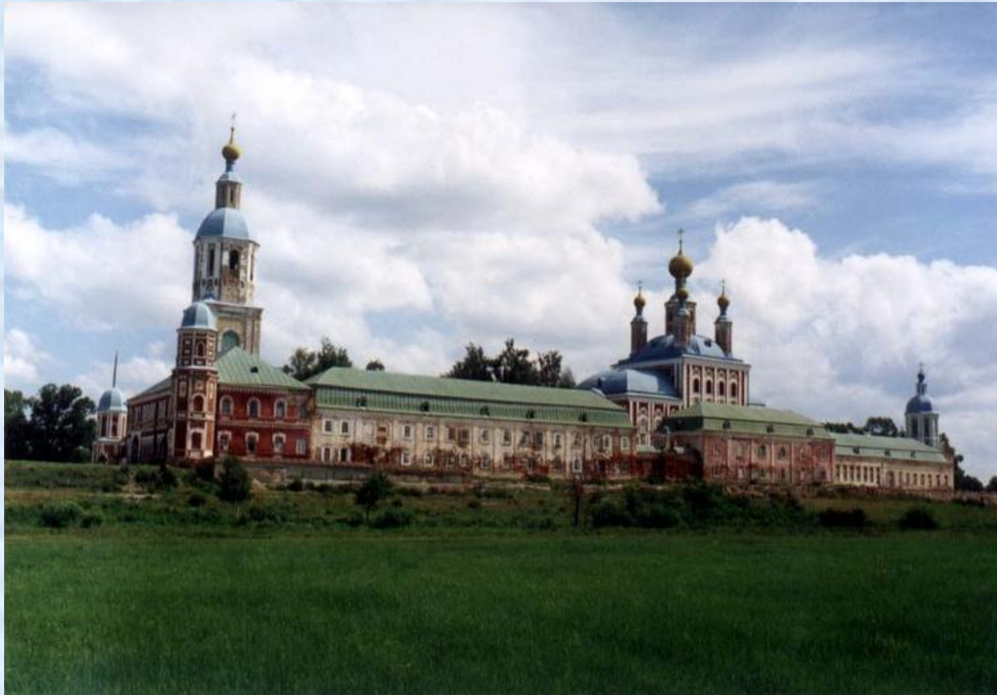
Санаксарский мужской монастырь