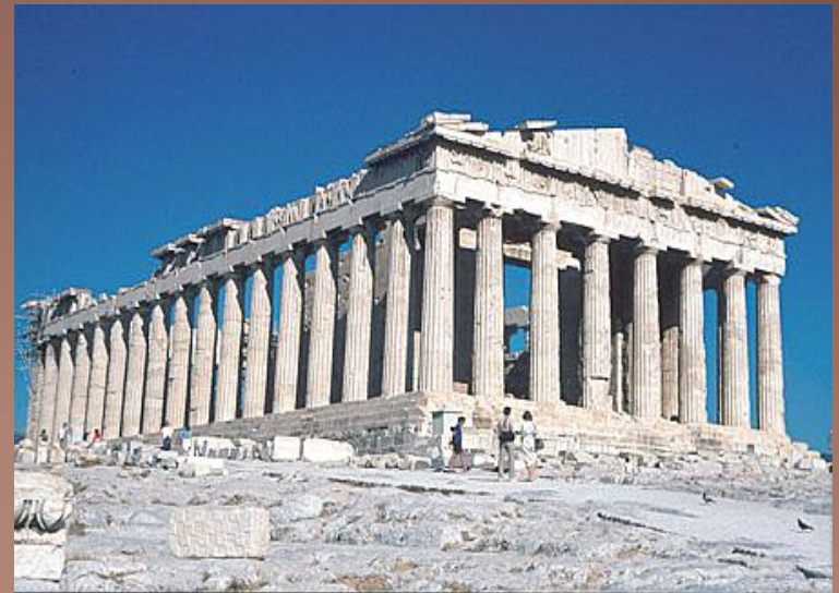
Главный храм Древних Афин - Парфенон

Отличительной особенностью этих стилей является форма колонн - неременного атрибута древнегреческих сооружений.