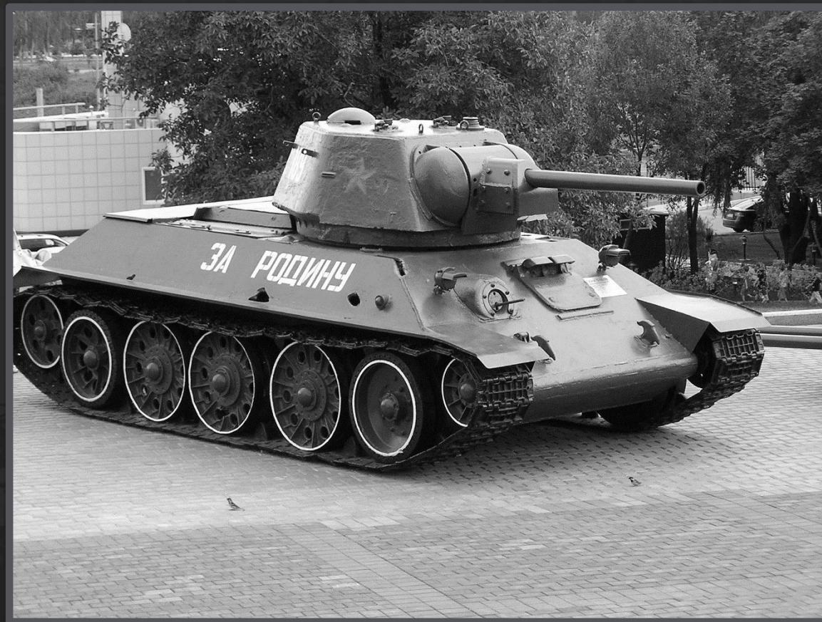
Танк, выигравший войну — Т-34