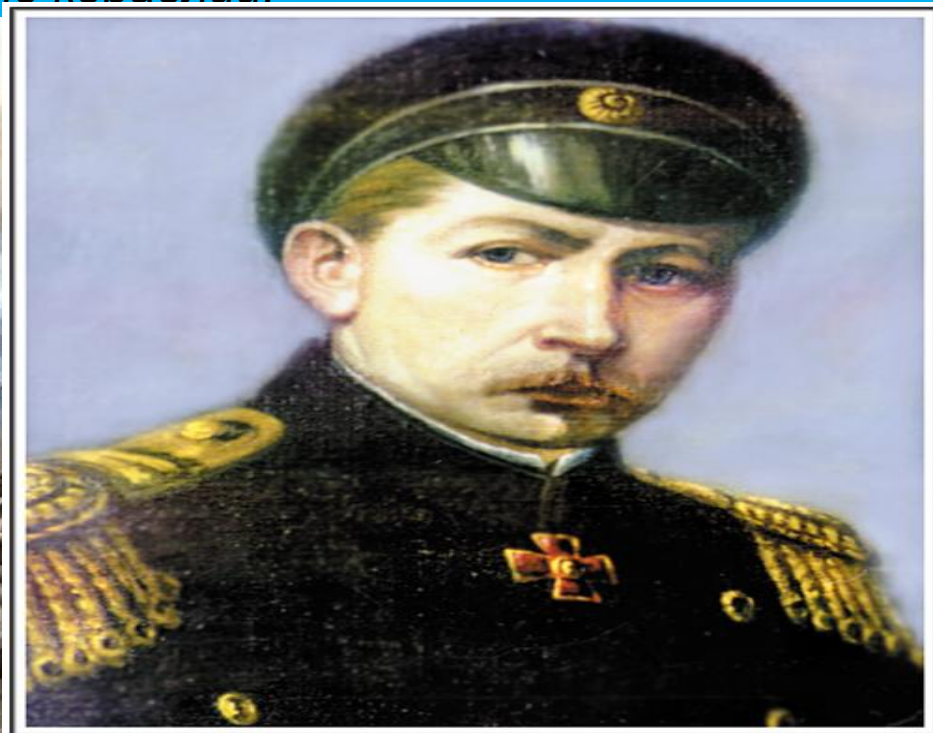
Адмирал П.С. Нахимов