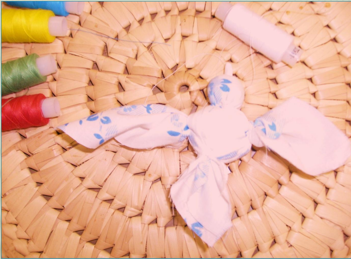
7. перетяжка крыльев, вариант 1