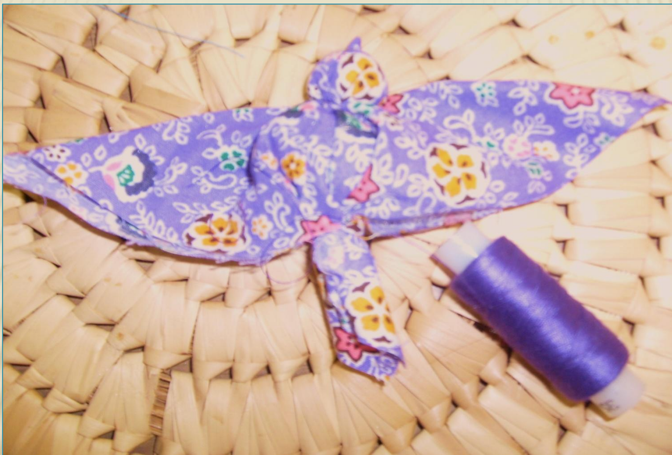
5. перетяжка туловища, вариант 1