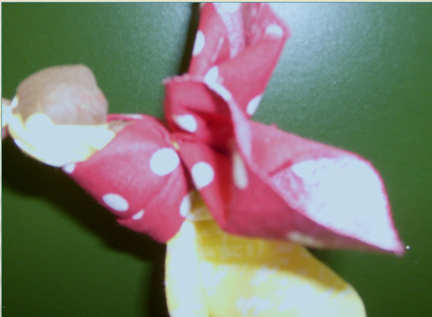
8. Перетяжка крыльев, вариант 2.