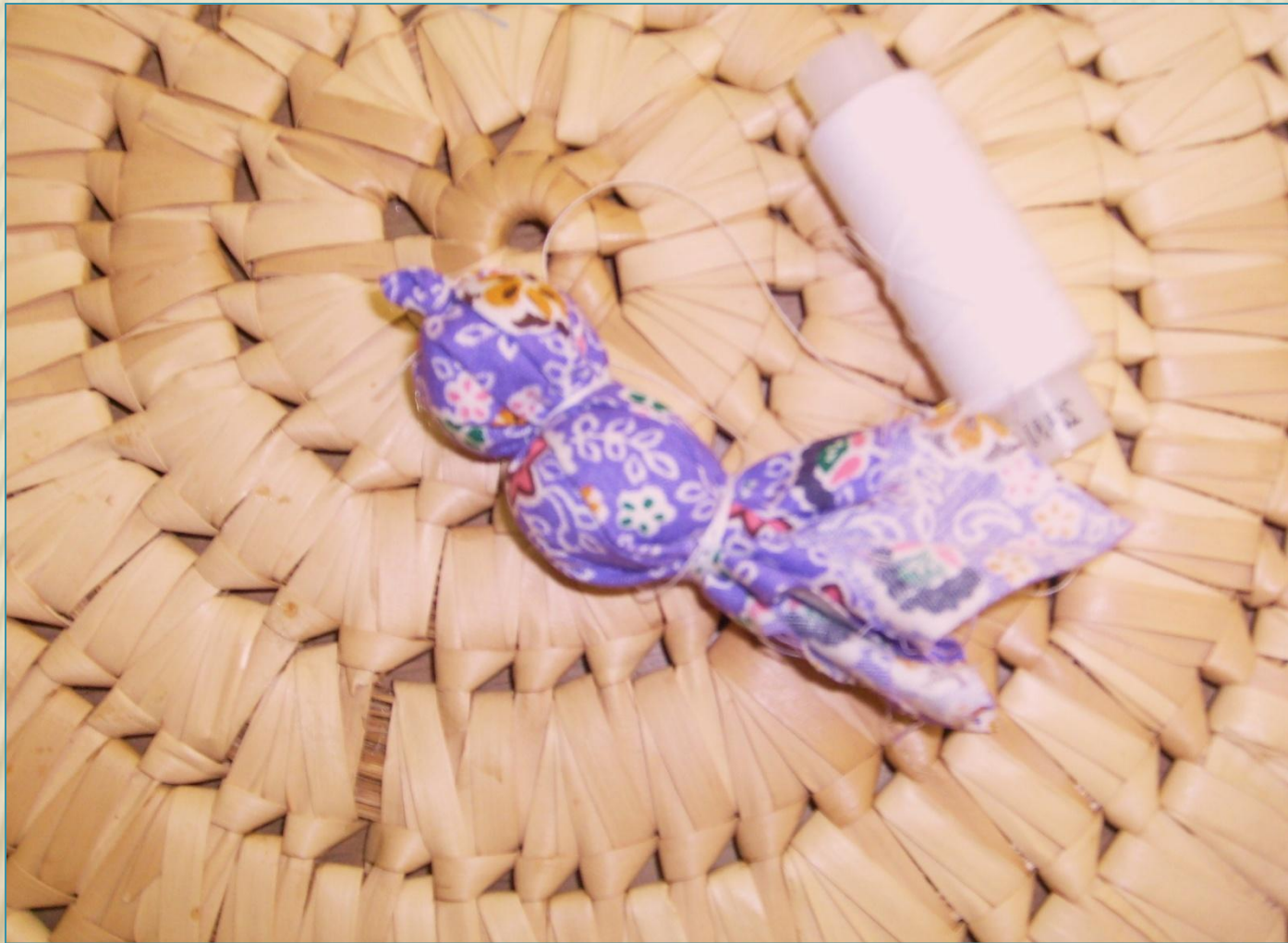
6. перетяжка туловища, вариант 2